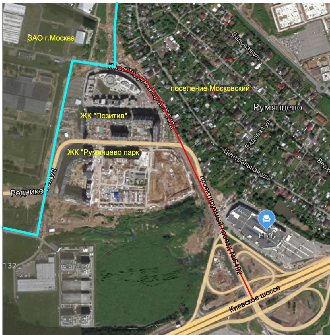
СХЕМА улицы Петра Непорожного на территории поселения Московский