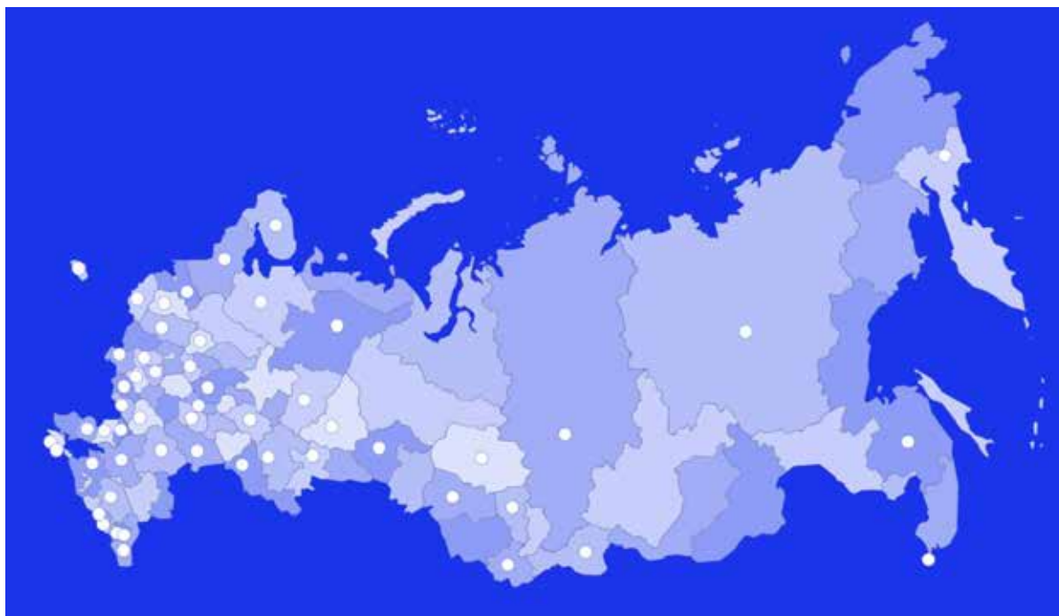
Рис. 1 – Регионы расположения Координационных центров.

центр в МИФИ работает в области гармонизации международного сотрудничества в образовательных, культурных и межрелигиозных проектах,