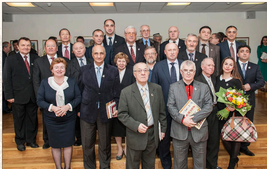
Участники Конференции «15 лет вместе», посвященной 15-летию со дня создания ГБУ «Московский дом национальностей»