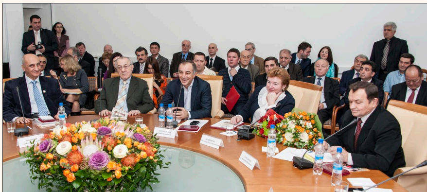
Участники Конференции «15 лет вместе»