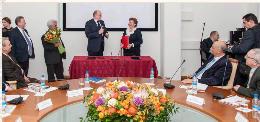
Подписание договора о сотрудничестве между Московским домом национальностей и Ассамблеей народов России