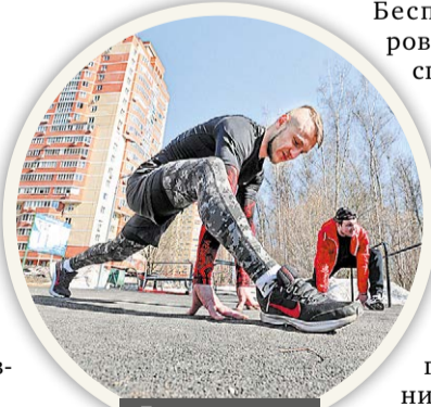
Присоединиться к зарядке может любой желающий