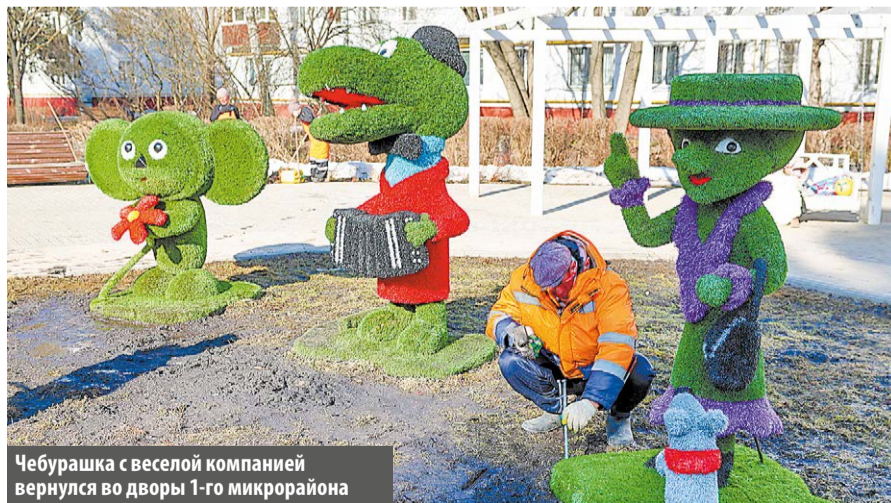
Чебурашка с веселой компанией вернулся во дворы 1-го микрорайона