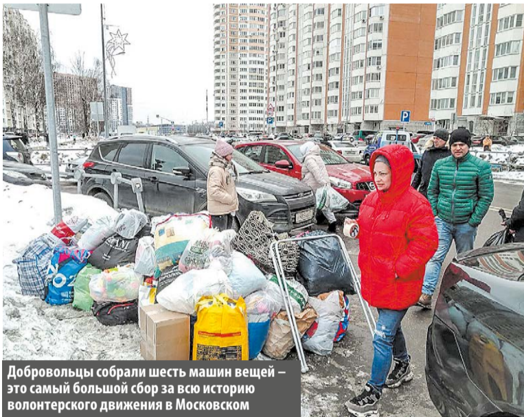
Добровольцы собрали шесть машин вещей – это самый большой сбор за всю историю волонтерского движения в Московском

– Были арендованы две грузовые машины: 20 и 18 кубов. В итоге количество участников сбора превысило все наши самые смелые ожидания. Шесть ма-