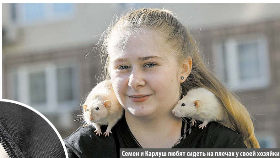
Семен и Карлуш любят сидеть на плечах у своей хозяйки

Характер у декоративных грызунов ласковый, игривый и очень социальный. Именно поэтому заводят их обычно по двое – одинокие питомцы живут значительно меньше своих компанейских собратьев.