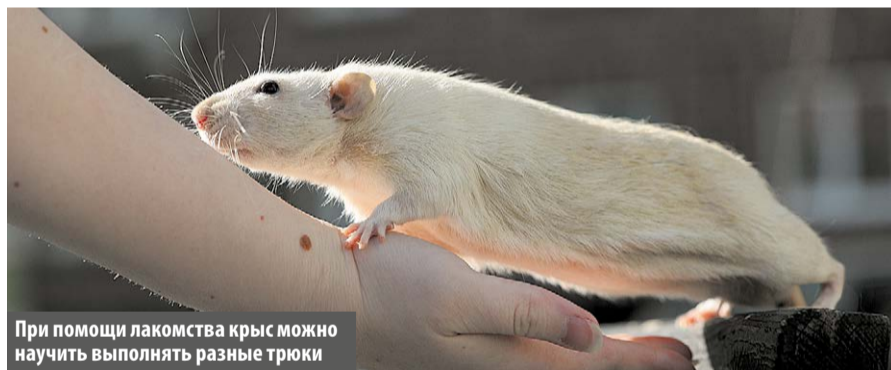
При помощи лакомства крыс можно научить выполнять разные трюки

В 1-м микрорайоне Московского заменили топиарные скульптуры любимых всеми героев кукольного мультипликационного фильма Романа Качанова, поставленного по мотивам книги Эдуарда Успенского «Крокодил Гена и его друзья».