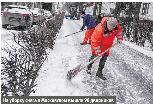
На уборку снега в Московском вышли 90 дворников