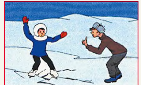
Если под вами затрещал лед, появились трещины – не паникуйте, не бросайтесь убежать! Плавно ложитесь на лед и перекатывайтесь в ту сторону, откуда шли.