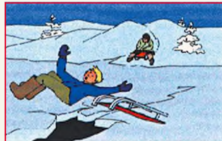
Внимание! Устье рек, вмерзшая растительность, трещины указывают на слабость льда