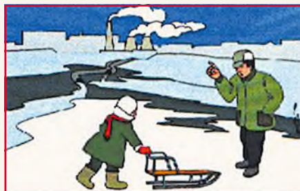
Осторожно! В таких местах даже после сильных морозов лед слабый.