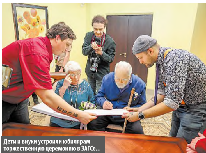
Дети и внуки устроили юбилярам торжественную церемонию в ЗАГСе...

Как снова оказаться в ЗАГСе и танцевать под марш Мендельсона спустя полвека после свадьбы? Московские дворцы бракосочетания предлагают провести красивую церемонию для юбиляров супружеской жизни. Такую услугу, причем совершенно бесплатно, могут заказать супруги, прожившие в браке 5, 10, 15 и более лет, но самое трогательное, когда в ЗАГС возвращаются «золотые пары» и их сопровождают дети, внуки, правнуки.