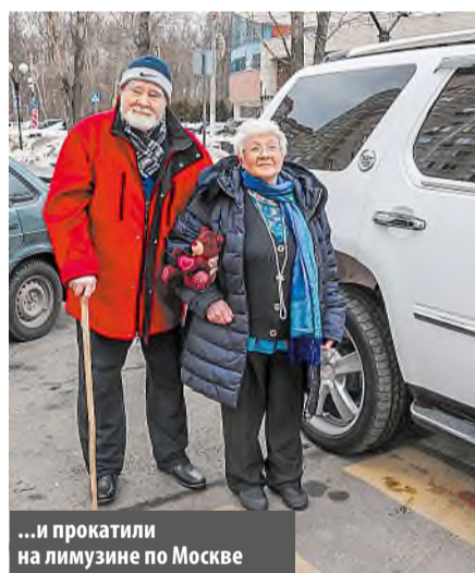
...и прокатили на лимузине по Москве

Светлана ГАВРИЛОВА