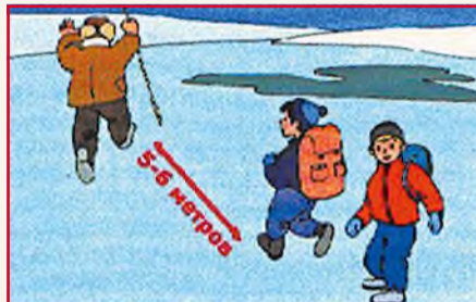
Не выходите на лед в одиночку! Не проверяйте прочность льда ногами!