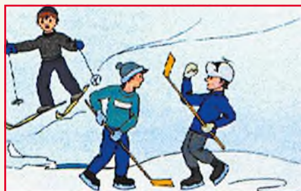
Будьте осторожны во время игр на льду. Под снегом могут быть полынья и лунки.