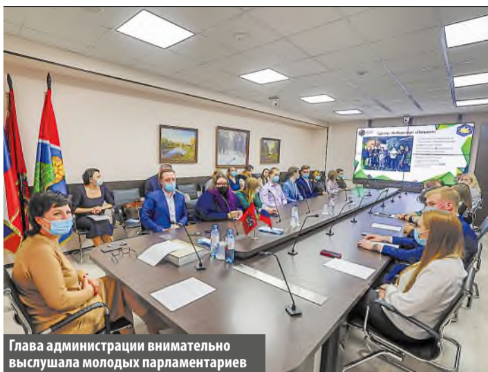
Глава администрации поселения внимательно выслушала молодых парламентариев