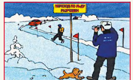
При переходе по льду в незнакомом месте держитесь найденных тропинок.