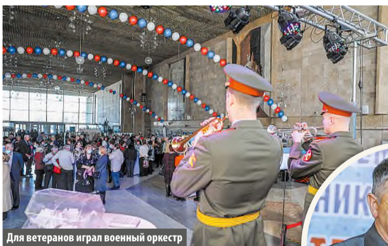
Для ветеранов играл военный оркестр

Военнослужащие, члены Советов ветеранов поселений ТиНАО и другие представители старшего поколения были приглашены на окружное мероприятие, посвященное Дню защитника Отечества.