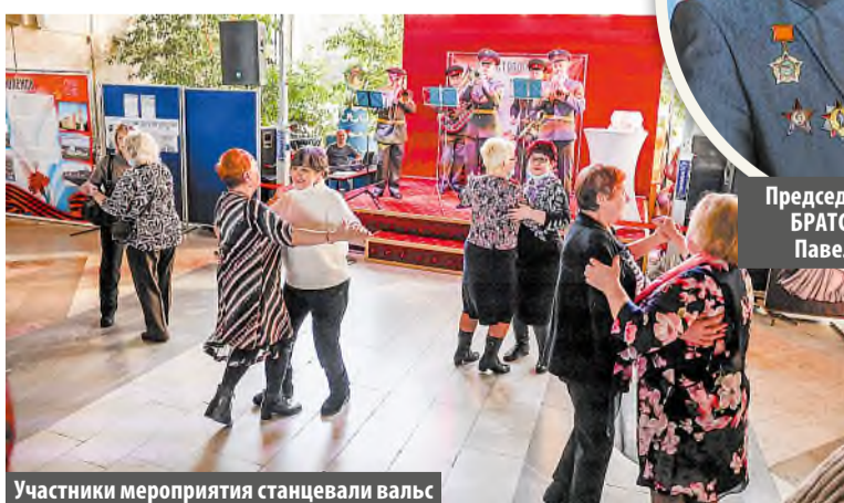
Участники мероприятия танцевали вальс

В фойе гостей встречали девушки, одетые в военную форму времен Великой Отечественной войны. Настроение создавал духовой оркестр, играющий песни и марши, посвященные нашей армии и флоту. В фотозоне можно было сделать и сразу получить фотографию с символикой праздника. Для гостей организовали праздничную лотерею.