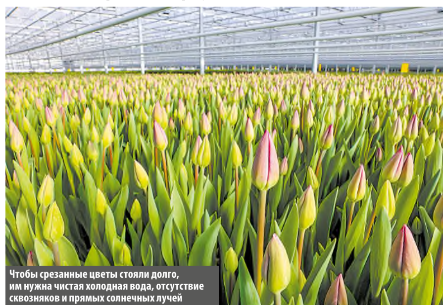
Чтобы срезанные цветы стояли долго, им нужна чистая холодная вода, отсутствие сквозняков и прямых солнечных лучей