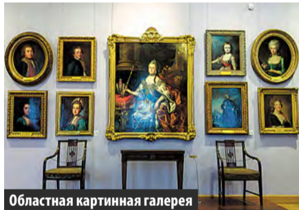
Областная картинная галерея

Прибыть на вокзал – первую достопримечательность города, которая встречает туристов. Здание построено в середине XIX века в русско-византийском стиле. Здесь сохранились императорские комнаты с мраморным каминном, дубовыми паркетами и шикарной люстрой, изготовленной местными стеклодувами.