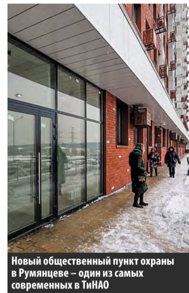
Новый общественный пункт охраны в Румянцеве – один из самых современных в ТиНАО