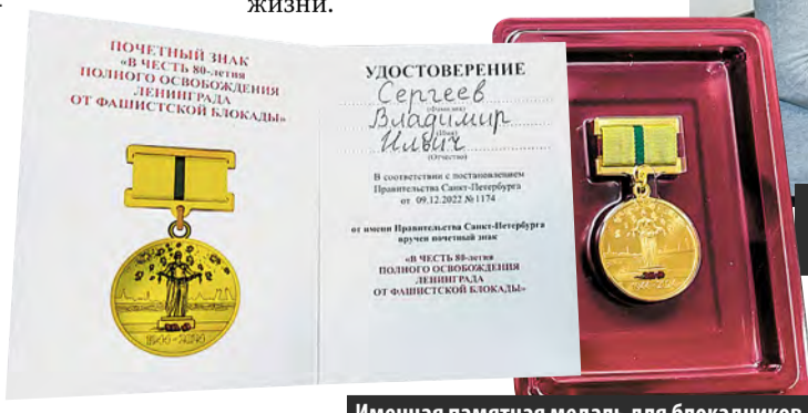
Именная памятная медаль для блокадников

Блокадникам вручили памятные медали, подарки и цветы, а также пожелали крепкого здоровья, бодрости духа и долгих лет жизни.