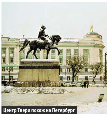
Центр Твери похож на Петербург