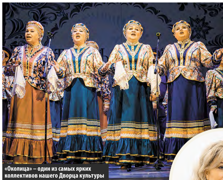
«Околица» – один из самых ярких коллективов нашего Дворца культуры

В ДК «Московский» состоялся праздничный концерт