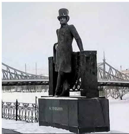
Пушкин любил бывать в здешних именах – здесь он познакомился с Анной Керн

Тверь расположена на берегах реки Волги, в районе впадения в нее рек Тверцы и Тьмаки, и основана в 1135 году. То есть она старше Москвы на 12 лет и в XIV веке соперничала с ней за звание столицы. Большую часть XX века город носил имя «всесоюзного старосты» Михаила Калинина. Место богато историей различных периодов, а находится от нас всего в 180 километрах, что делает поездку туда удобной на поезде, автобусе или личном автомобиле.