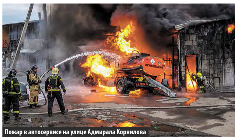
Пожар в автосервисе на улице Адмирала Корнилова

– Трубу необходимо обкладывать негорючими материалами, а перед топкой печи укладывать металлический лист, чтобы деревянный пол не воспламенился, если из топки вылетят продукты горения. Кроме того, необходимо следить, чтобы рядом с печью не стояли вещи и мебель. Минимальное расстояние до печи – 50 сантиметров, – отметил сотрудник МЧС.