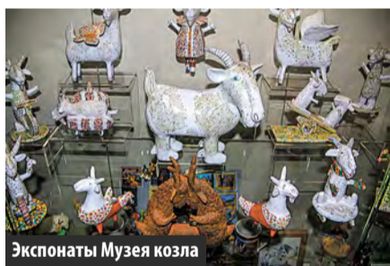
Экспонаты Музея козла