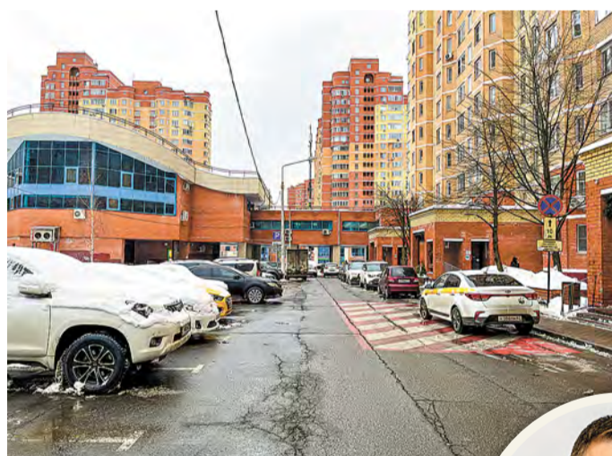
Дворы и проезды 3-го микрорайона в Московском – одни из самых оживленных

В Граде и 3-м микрорайоне заменят асфальт на дорожках и тротуарах, а также оформят зеленые газоны.