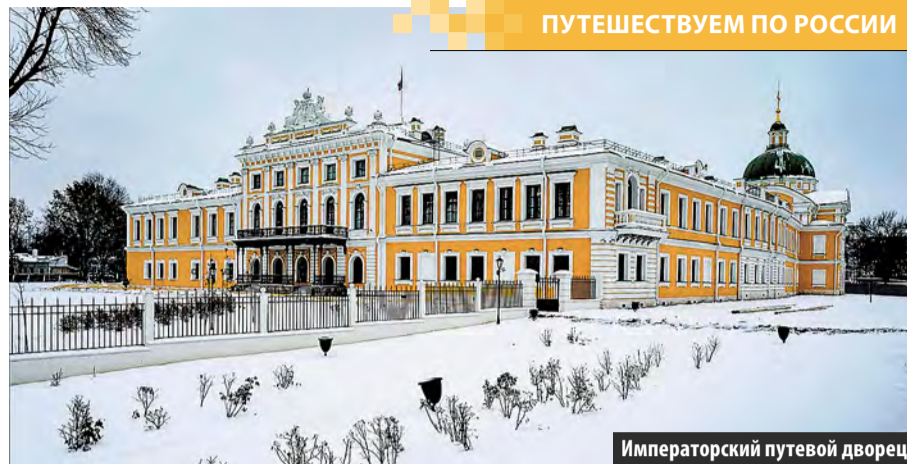
Императорский путевой дворец