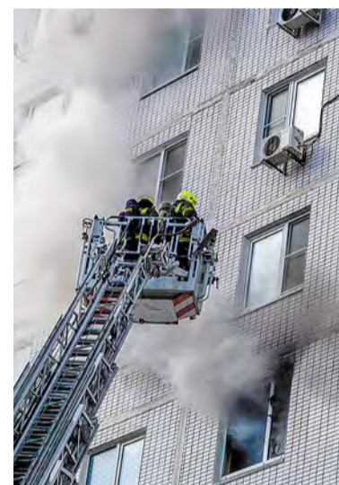
Огнеборцы спасают горящий дом 18 в 1-м микрорайоне в ноябре прошлого года

Но главное при пожаре – верно оценивать собственные силы. Если возгорание небольшое, с ним можно справиться самостоятельно. А в случаях, когда площадь пожара увеличилась, необходимо как можно быстрее покинуть помещение и вызвать пожарных по номеру 112 или 103.