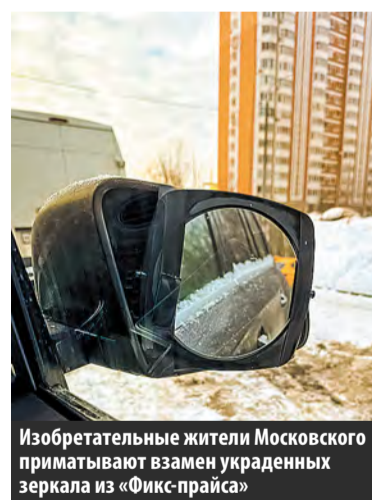
Изобретательные жители Московского приматают взамен украденных зеркал из «Фикс-прайса»

Массовая кража зеркал с автомобилей произошла в Граде Московском. В ночь с 20 на 21 января боковых зеркал одновременно лишились больше двух десятков автовладельцев. Общий ущерб пострадавшие оценивают в сотни тысяч рублей.