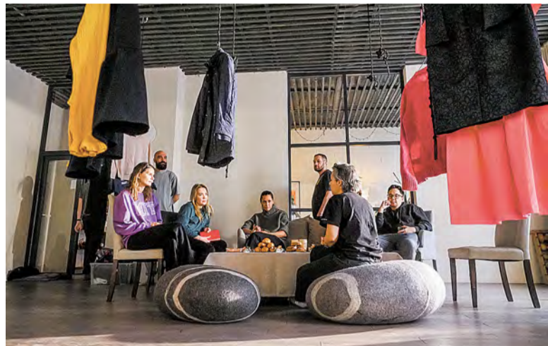
Каждый принес на встречу лишние вещи

Жители Московского обменялись вещами на своп-вечеринке