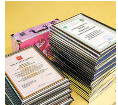
Дипломы-благодарности для отличившихся