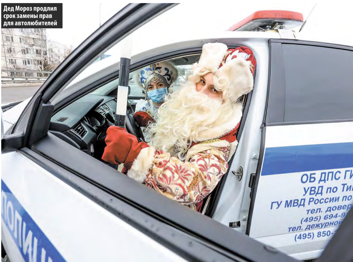
Дед Мороз продлил срок замены прав для автолюбителей

Новый год принес нам и новые изменения в законодательстве . Кого-то ждет увеличение зарплаты и социальных выплат, а кого-то – пересдача экзаменов в ГИБДД.