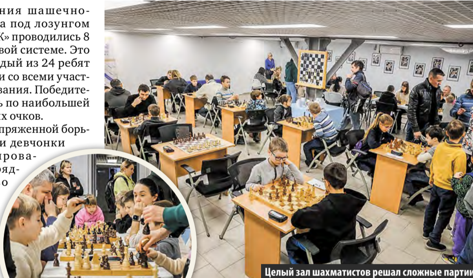
Целый зал шахматистов решал сложные партии