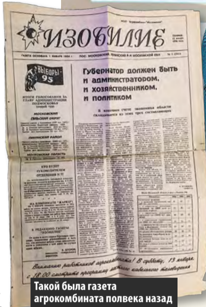
Такой была газета агрокомбината полвека назад