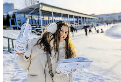
График работы катков может изменяться в зависимости от погодных условий. Получить дополнительную информацию о работе ледовых площадок можно по телефону Центра Спорта 8(495) 841-06-53.

Катки ЦСМ работают: понедельник с 14:00 до 22:00 (технический перерыв с 09:00 до 14:00); вторник – воскресенье с 11:00 до 22:00 (технический перерыв с 14:00 до 15:30).