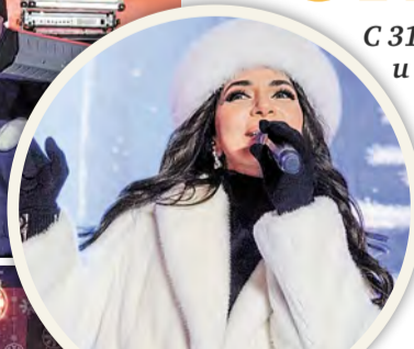
Певица Зара в Московском

Рекордные новогодние заморозки жителей Московского не напугали. С самого начала концертной программы – 31 декабря в 17:00 – артистов встречали дружными аплодисментами.