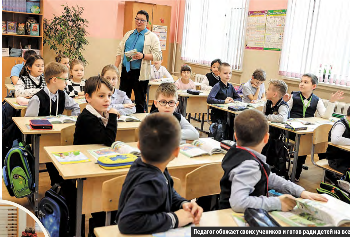
Педагог обожает своих учеников и готов ради детей на все

Президент Владимир Путин объявил наступивший 2024 год в России Годом семьи. Представителя одной из блестящих семейных династий страны корреспонденты «МС» нашли в Московском.