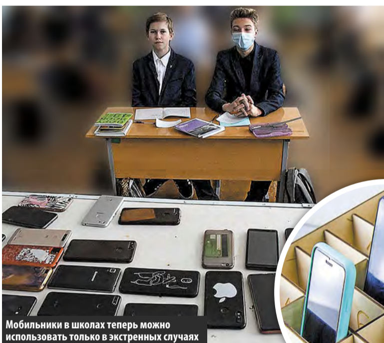
Мобильники в школах теперь можно использовать только в экстренных случаях