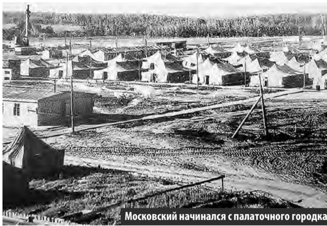
Московский начинался с палаточного городка