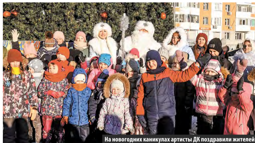
На новогодних каникулах артисты ДК поздравили жителей

Дарья СОКОЛОВА