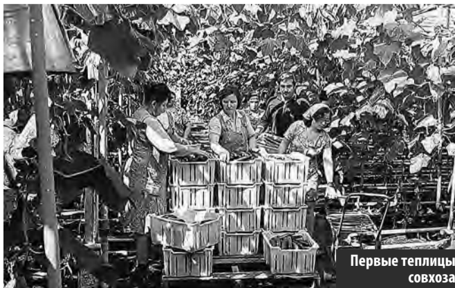
Первые теплицы совхоза