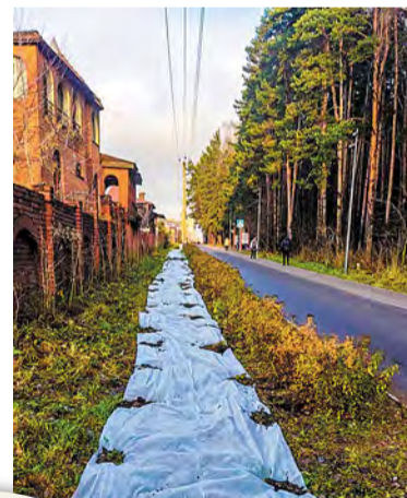
Растения укутали накануне снегопадов

– На территории парка Говоровский лес проведены работы по подготовке зеленых насаждений к зиме. Мероприятие необходимо, ведь растения являются не только украшением нашей окружающей среды, но и выполняют важные экологические функции. Рабочие обеспечили закрытие кустарников, которые не могут выдержать сильные морозы. С помощью специальных материалов сотрудники подрядной организации защитили посадки от холода, обеспечивая оптимальные условия для зимовки, – рассказал депутат Совета депутатов поселения Московский Сергей Лебедев.