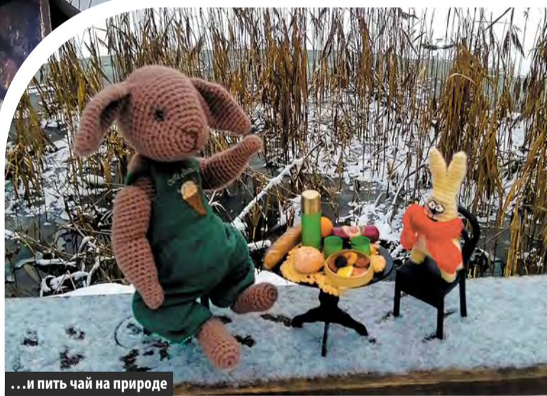
...и пить чай на природе