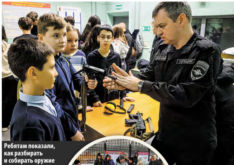
Ребятам показали, как разбирать и собирать оружие

Учащиеся 7 и 9 классов школы № 2120 побывали в отделе полиции на улице Лаптева. Школьникам показали, как берутся отпечатки пальцев и как они используются для поиска преступников. Затем кинологи продемонстрировали работу служебных собак. Всего за несколько минут обученная овчарка нашла спрятанную в колесе автомобиля вату со «взрывчатым веществом» и безошибочно определила, в какой из четырех сумок находится пистолет. Ребята не переставали удивляться находчивости и уму служебных собак. Затем школьников повели в стрелковый центр, где полицейские отрабатывают навыки огневой подготовки. Инструкторы рассказали, какие