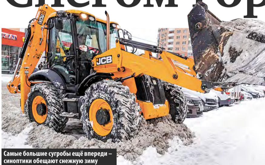
Самые большие сугробы ещё впереди – синоптики обещают снежную зиму

Обрушившуюся на Москву первую в этом году метель синоптики еще на подходе окрестили «черной». Виной тому стал балканский циклон, надвигавшийся на столицу с западной акватории Черного моря. И хотя пока рекорд по высоте сугробов не побит, метеорологи предупреждают: еще не вечер.