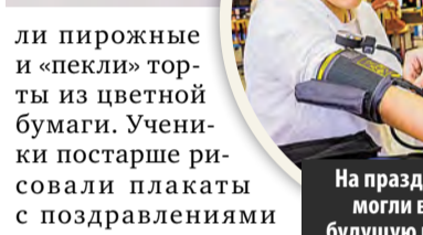
На празднике дети могли выбрать будущую профессию

ли пирожные и «пекли» торты из цветной бумаги. Ученики постарше рисовали плакаты с поздравлениями и делали моментальные фото для всех желающих. Творческие коллективы подготовили танцы, песни и сценки, кадеты и ученики профильных направлений – мастер-классы, а маленькие художники украсили стены вернисажем с рисунками школы. Напротив актового зала возвышался огромный бумажный торт.