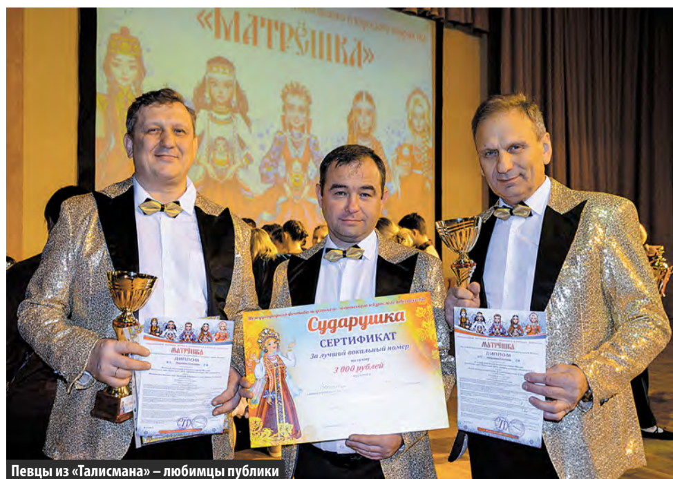
Певцы из «Талисмана» – любимцы публики

Артисты ДК «Московский» собрали урожай наград.