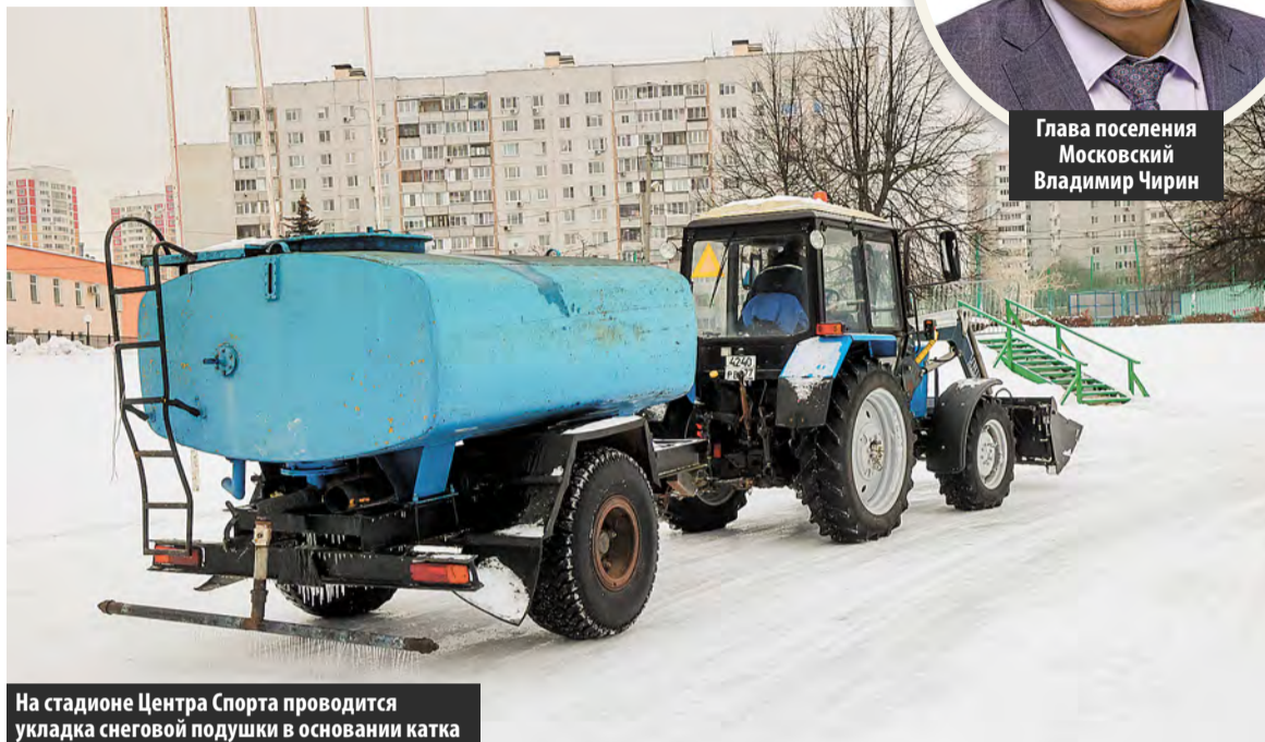
На стадионе Центра Спорта проводится укладка снеговой подушки в основании катка

Прошлые выходные застали москвичей врасплох обильными снегопадами и стабильной отрицательной температурой. Для автолюбителей – беда, зато для поклонников зимнего спорта – знак: пора доставать лыжи с антресолей и точить коньки.