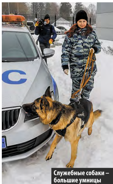
Служебные собаки – большие умницы

Светлана ГАВРИЛОВА