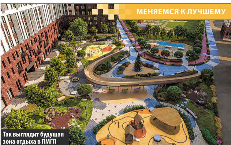
Так выглядит будущая зона отдыха в ПМГП