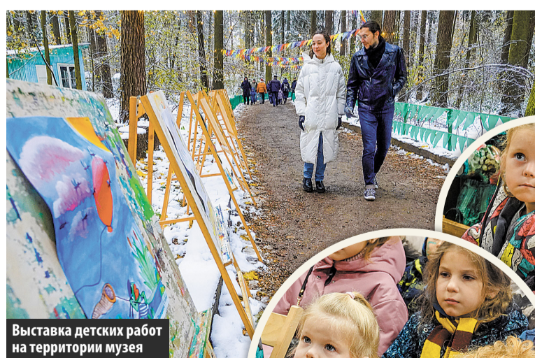
Выставка детских работ на территории музея

На полянке за домом дедушки Корнея стояла небольшая уютная сцена, на которой происходили основные действия. Зрители сидели на длинных лавочках, защищенных большим навесом от осадков и ветра. Это были самые снежные и холодные дни октября, но, по словам заслуженной артистки России Екатерины Гусевой, все могли согреться поэзией. Актриса открыла фестиваль музыкально-литературной композицией «Сказки Пушкина».