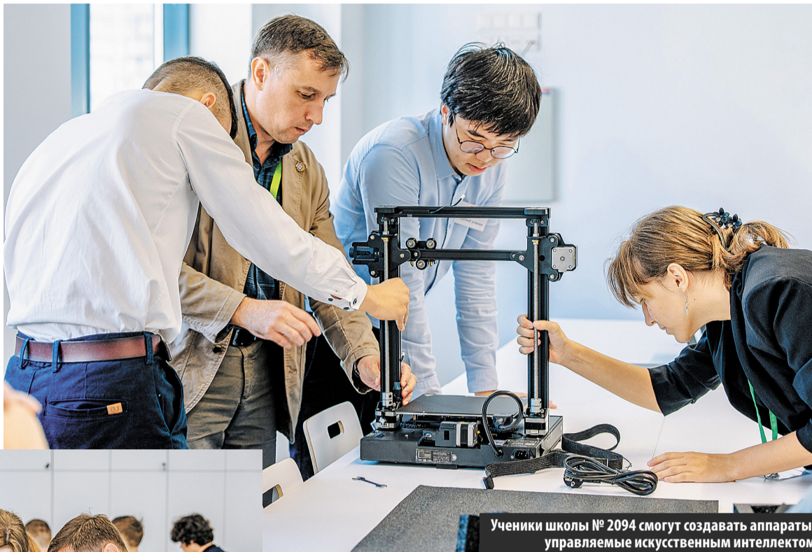
Ученики школы № 2094 смогут создавать аппараты, управляемые искусственным интеллектом

Всего в этом году планируется набрать 3-4 группы. В общей сложности обучение по инновационной программе, разработанной школой «Летово» при поддержке компании ПИК, смогут проходить до 100 детей в год. При этом присоединиться к ней смогут не только «технари», но и «естествонаучники» и даже гуманитарии: искусственный