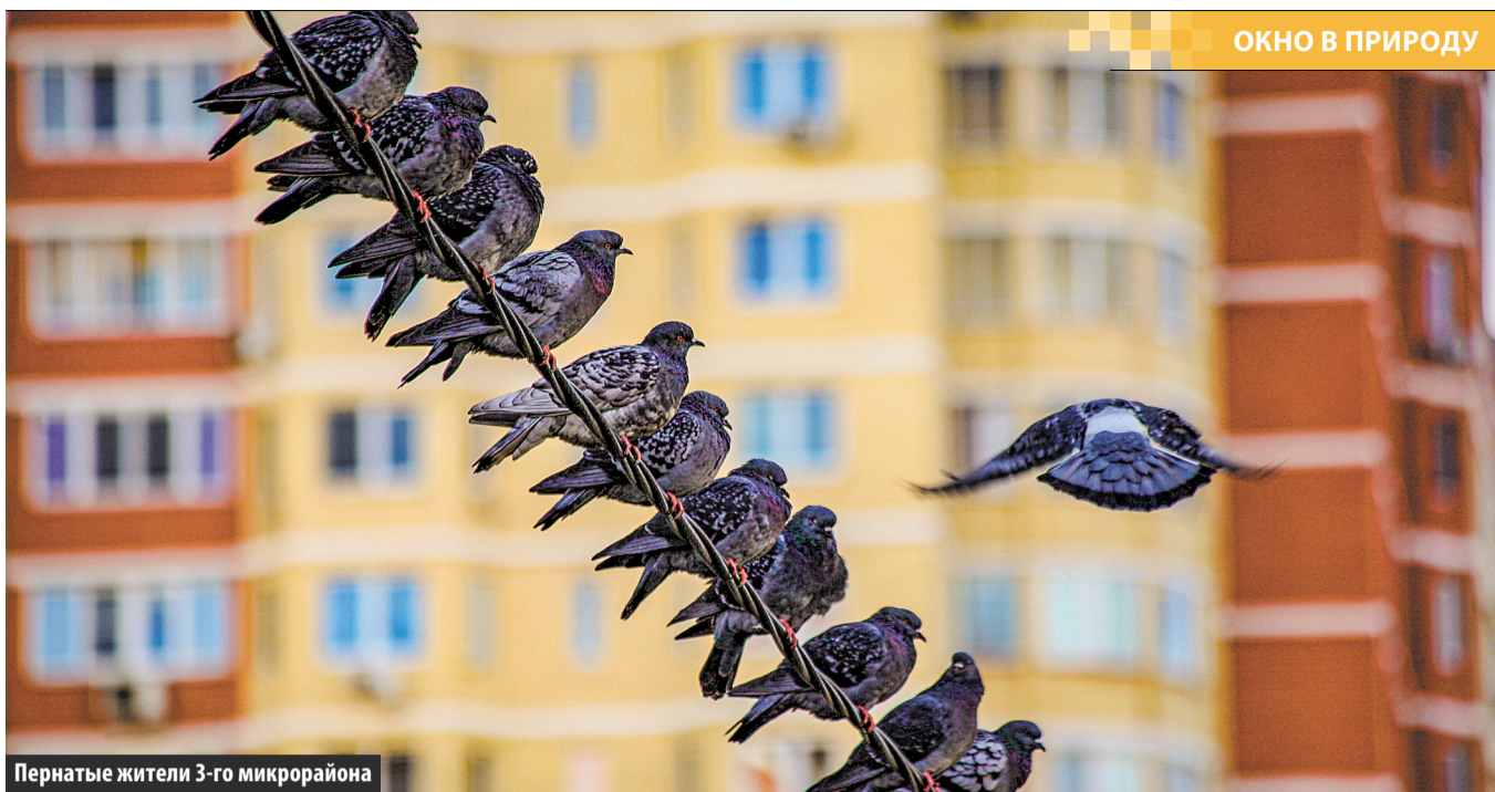
Пернатые жители 3-го микрорайона