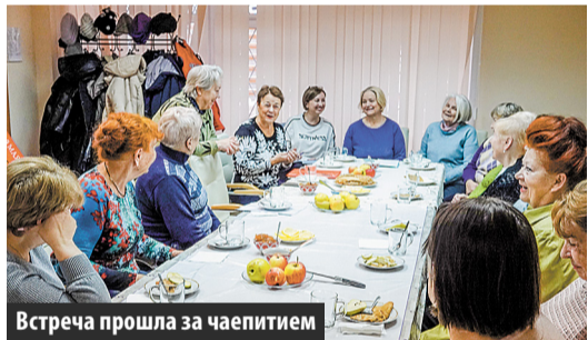
Встреча прошла за чаепитием