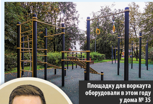
Площадку для воркаута оборудовали в этом году у дома № 35

Развитию физической культуры и спорта в поселении Московский уделяется большое внимание – проводятся спортивные мероприятия различных уровней, реализуются проекты, появляются новые спортивные площадки, а о спортивных успехах наших жителей говорит множество наград.