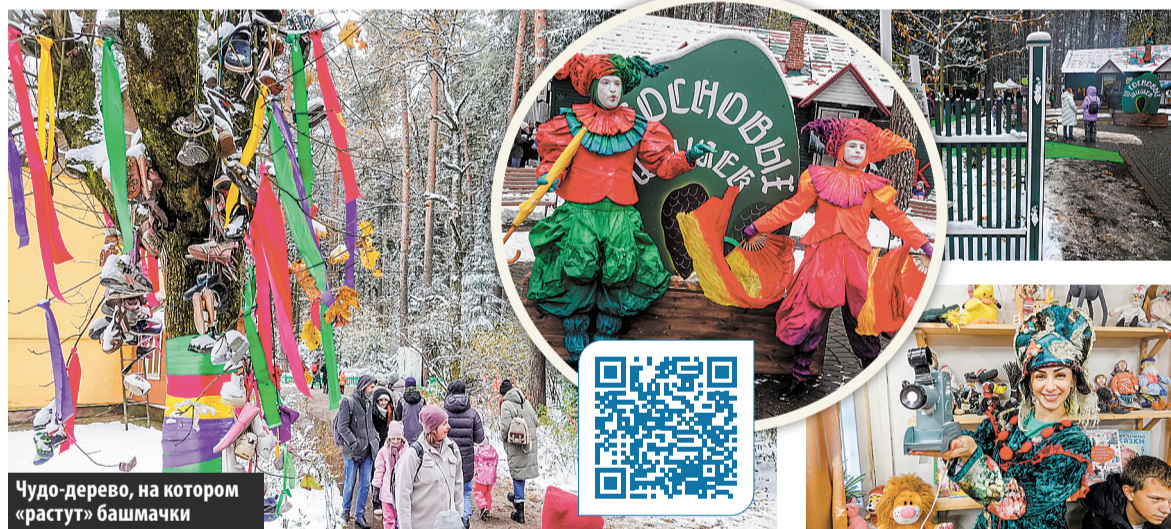
Чудо-дерево, на котором «растут» башмачки

28 и 29 октября в доме-музее детского писателя в Перedelкино проходил фестиваль «10 сосновых шишек».