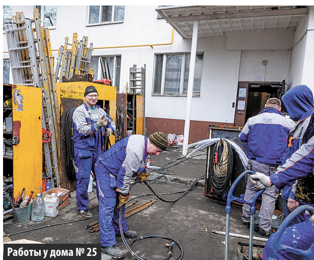
Работы у дома № 25