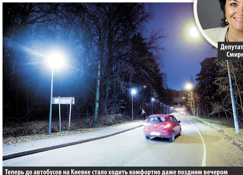
Теперь до автобусов на Киевке стало ходить комфортно даже поздним вечером

Завершились работы по установке и подключению фонарей в деревне Мешково.