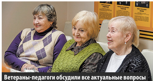
Ветераны-педагоги обсудили все актуальные вопросы