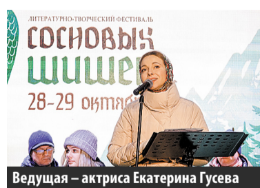
Ведущая – актриса Екатерина Гусева

Традицию устраивать посиделки у костра на поляне за домом зародил еще сам дедушка Корней 67 лет назад. С тех пор ей стараются не изменять (исключение – пандемия) – и устраивать большой праздник детской литературы два раза в год: осенью и весной. Символическая плата за вход на такие «костры Чуковского», как и при жизни писателя, – 10 сосновых шишек. Ими и разжигают костер, вокруг которого в конце мероприятия все танцуют и водят хороводы. Основные участники фестиваля – дети и их родители. Ребята