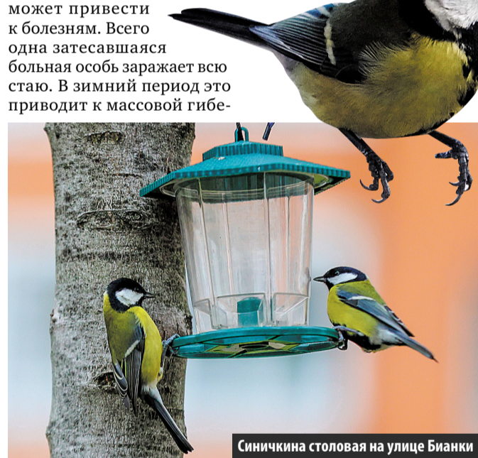
Синичкина столовая на улице Бианки

птиц. К тому же большие стаи наносят вред городской инфраструктуре – помет разбедает стены зданий и карнизы.