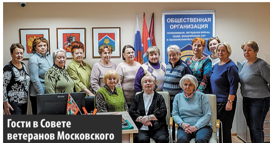
Гости в Совете ветеранов Московского

В помещении Совета ветеранов в ДК 27 октября состоялась рабочая встреча членов Совета ветеранов педагогического труда с коллегами из ТиНАО. На мероприятии они обсудили проделанную работу за последний год, поделились планами, обменялись опытом.