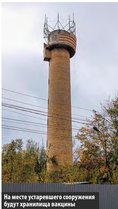
На месте устаревшего сооружения будут хранилища вакцины