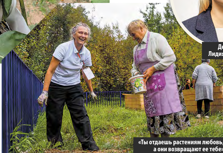
«Ты отдаешь растениям любовь, а они возвращают ее тебе»

Июлия РАСКАЗОВА