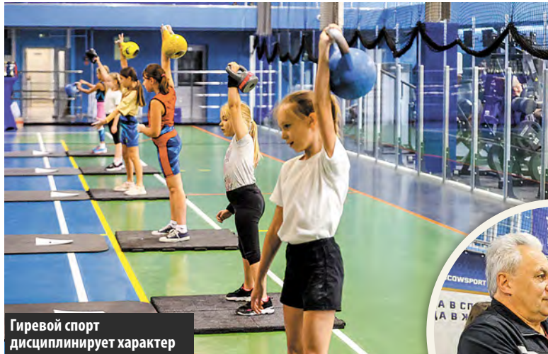
Гиревой спорт дисциплинирует характер

В ФСК Центра Спорта «Московский» в 1-м микрорайоне состоялась Первенство поселения Московский по гиревому спорту среди детей под лозунгом: «Дети за мир».