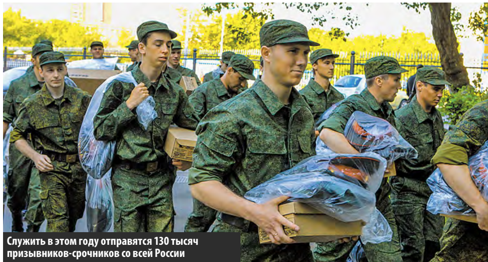
Служить в этом году отправятся 130 тысяч призывников-срочников со всей России