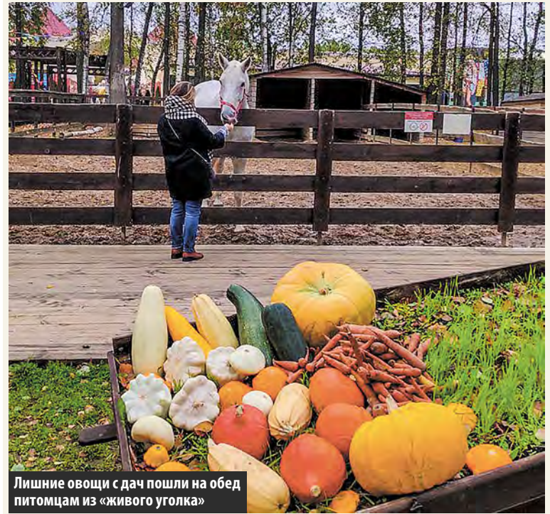
Лишние овощи с дач пошли на обед питомцам из «живого уголка»

В выходные в ТРЦ «Новомосковский» состоялась осенняя ярмарка «Круг Мастеров». В ее рамках жители Московского собрали тележку овощей для животных из контактного зоопарка «Внуково аутлет».