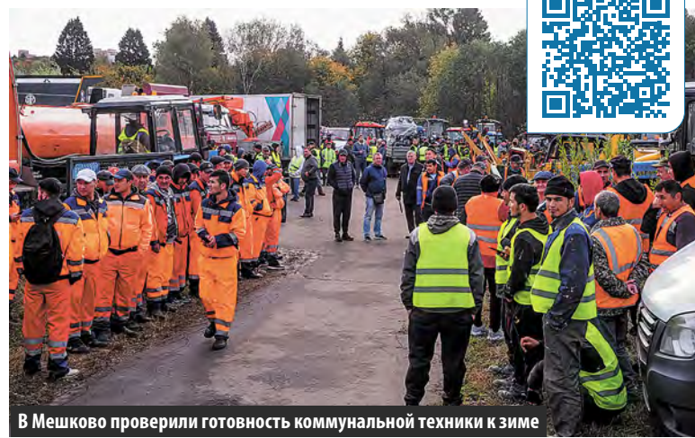
В Мешково проверили готовность коммунальной техники к зиме

Большинство представленных машин – многофункциональные, могут использоваться для разных задач. Например, у КАМАЗов есть