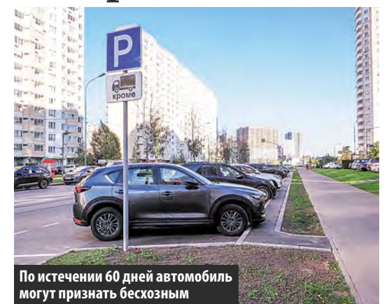
По истечении 60 дней автомобиль могут признать бесхозным

Поставить машину в неполюженном месте станет дорожно. О повышении стоимости эвакуации автомобилей водителей предупредил столичный Дептранс.