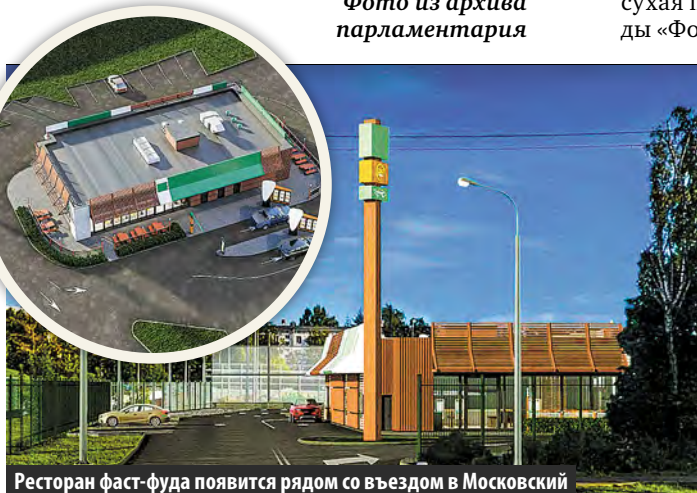
Ресторан фаст-фуда появится рядом со въездом в Московский

Инесса РАСКАЗОВА