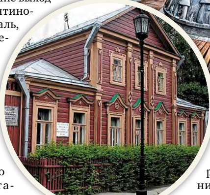
Дом академика Павлова

Сфотографироваться с необычными памятниками. На Трубезьской