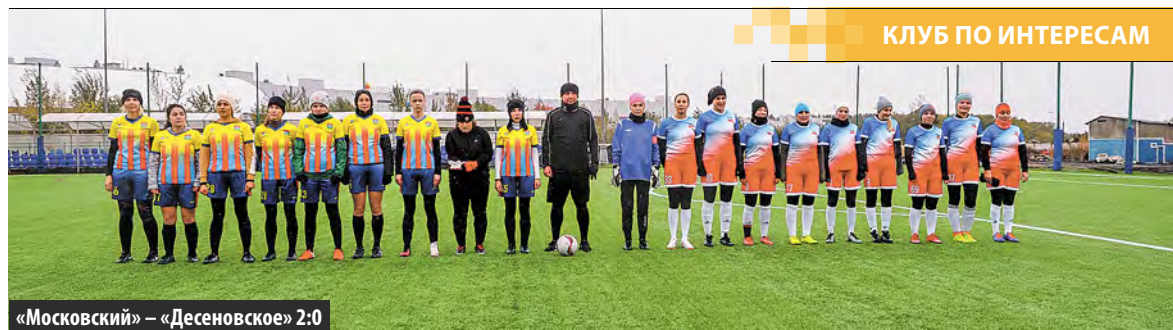
КЛУБ ПО ИНТЕРЕСАМ