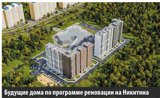
Будущие дома по программе реновации на Никитина

В настоящий момент ведется оформление необходимой градостроительной документации.