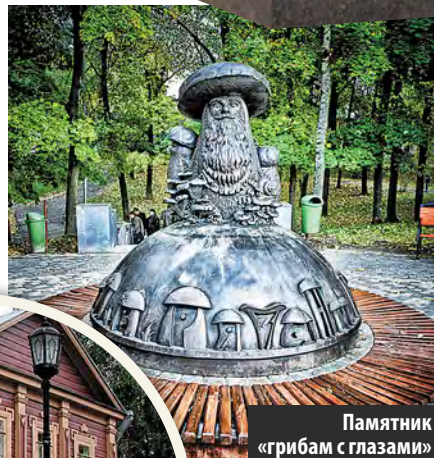
Памятник «грибам с глазами»

набережной на 80-ю годовщину со дня рождения Сергея Есенина установили исполинский памятник работы архитектора Александра Кибальникова. Поэт изображен в расстегнутой рубашке, читающий стихи.