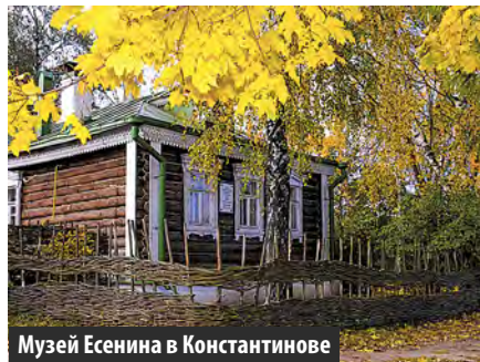
Музей Есенина в Константиново

Узнать все о ВДВ можно в музее, посвященном «голубым беретам». Он был основан в 1972 году при участии Василия Маргелова – самого известного командующего элитными войсками. Находится музей в здании 1816 года, где ранее располагалась духовная семинария. В экспозиции около 80 тысяч экспонатов: оружие, обмундирование, медали и так далее. Здесь же воссоздан личный кабинет «дяди Васи».