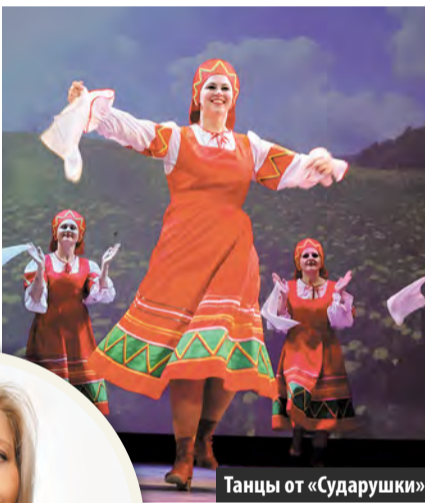
Танцы от «Сударушки»