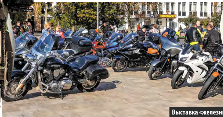
Выставка «железных коней» перед ДК