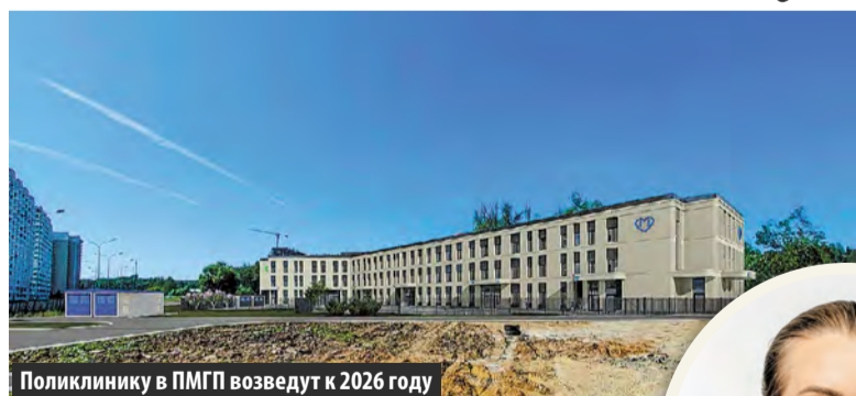
Поликлинику в ПМГП возведут к 2026 году

Утверждено архитектурно-градостроительное решение новой детско-взрослой поликлиники, которая будет возведена на улице Никитина в микрорайоне Первый Московский город-парк.