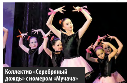
Коллектив «Серебряный дождь» с номером «Мучача»

– Эстрадный коллектив «Дети солнца» стал обладателем гран-при и звания лауреата I степени 10-го юбилейного международного фестиваля-конкурса