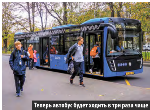
Теперь автобус будет ходить в три раза чаще

В Московском сократился интервал движения автобуса № 890. Об этом сообщил официальный телеграм-канал столичного Дептранса.