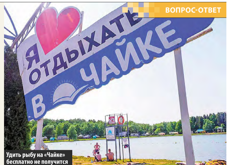
Удиль рыбу на «Чайке» бесплатно не получится