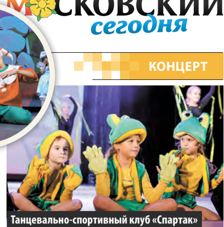
Танцевально-спортивный клуб «Спартак»

их внуков, а также других наших юных и взрослых артистов. От лица Совета депутатов поселения я поздравляю людей старшего поколения с этим замечательным днем. Желаю им здоровья, успехов и хорошего настроения. Этот концерт прошел и в их честь.