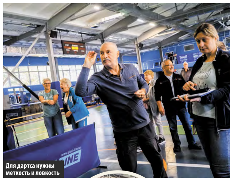
Для дартса нужны меткость и ловкость

В физкультурно-спортивном комплексе Центра Спорта «Московский» прошли соревнования для пенсионеров, посвященные Дню пожилого человека. Эти состязания уже стали традиционными, они проводятся каждый год Центром Спорта «Московский».