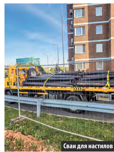
Сваи для настилов

Создание прогулочной зоны в Татьянин Парке началось в 2018 году. Тогда здесь появилась смотровая площадка с видом на пруд. В этом году работы по обустройству променада продолжились согласно единой концепции проекта по превраще-