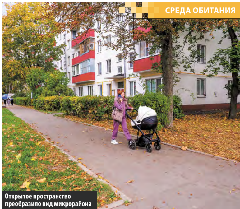
Открытое пространство преобразило вид микрорайона