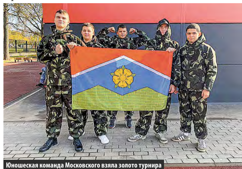
Юношеская команда Московского взяла золото турнира

Открытый турнир по пейнтболу среди команд Новой Москвы состоялся в поселении Первомайское. Наши спортсмены привезли сразу две награды с окружных соревнований.