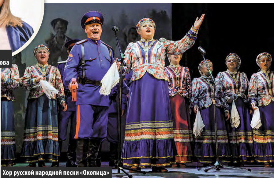
Хор русской народной песни «Околица»