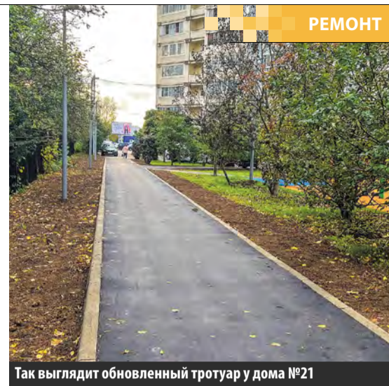
Так выглядит обновленный тротуар у дома №21

Ольга Смирнова. Николай ДУБИНИН