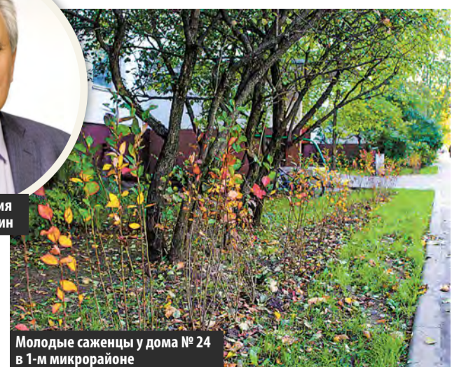
Молодые саженцы у дома № 24 в 1-м микрорайоне