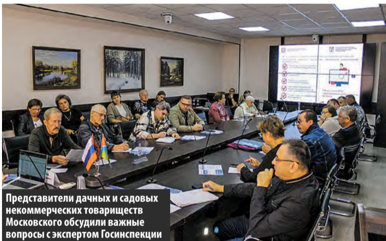
Представители дачных и садовых некоммерческих товариществ Московского обсудили важные вопросы с экспертом Госинспекции

В администрации прошла встреча жителей СНТ и других населенных пунктов, расположенных на территории поселения Московский. С представителями Госинспекции по недвижимости и администрации поселения дачники обсудили вопросы индивидуального жилищного строительства.