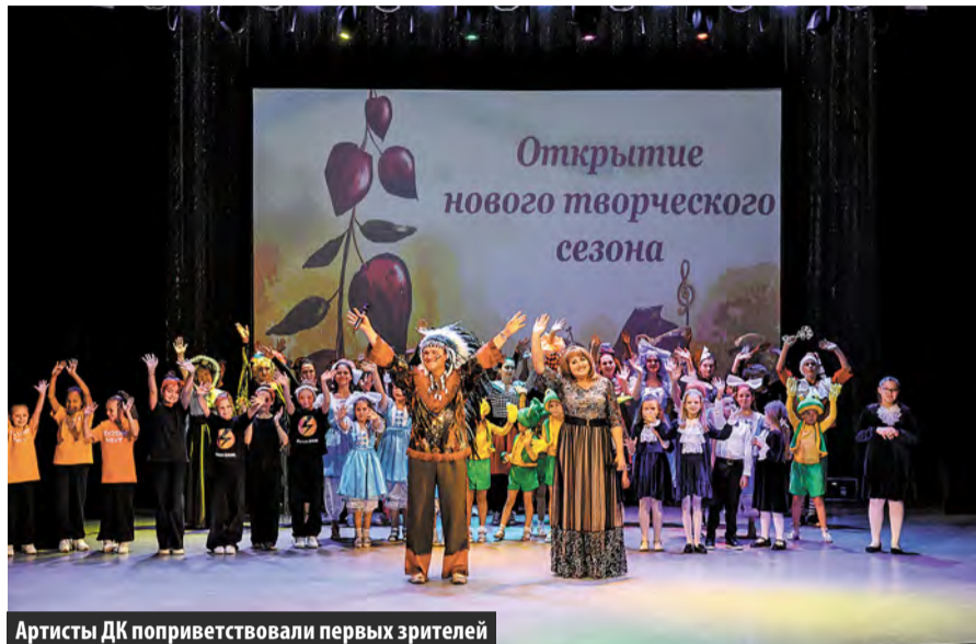
Артисты ДК поприветствовали первых зрителей

Дворец Культуры «Московский» открыл юбилейный 35-й сезон