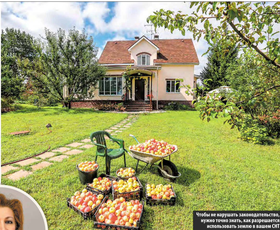
Чтобы не нарушать законодательство, нужно точно знать, как разрешается использовать землю в вашем СНТ