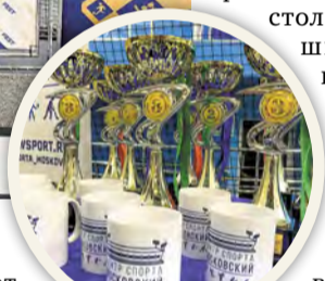
Чемпионам – кубки и кружки