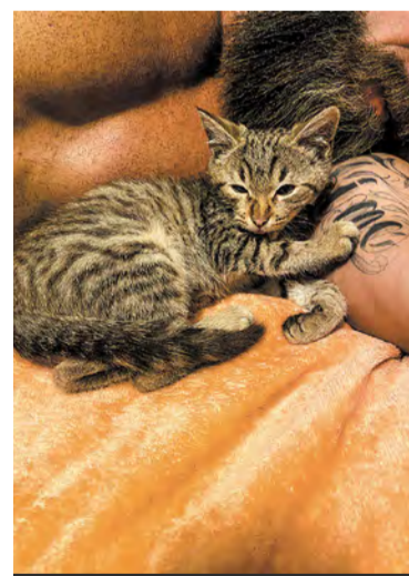
Вылечить котика дороже, чем человека