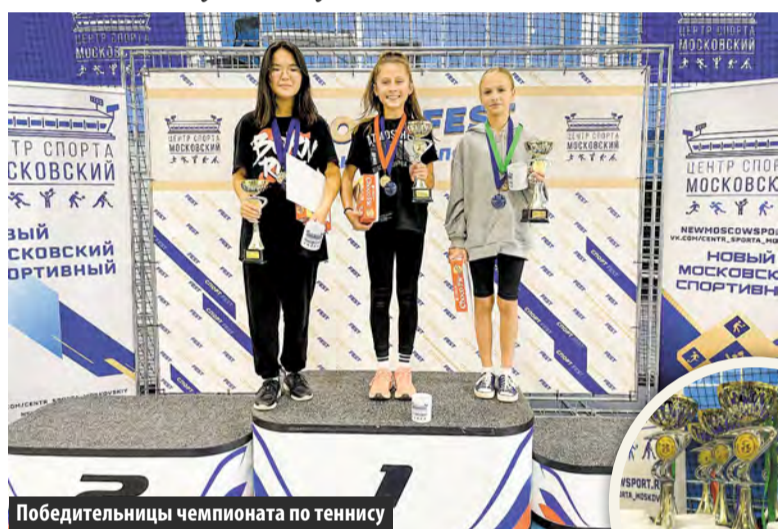
Победительницы чемпионата по теннису

Более 60 школьников от 8 до 17 лет приняли участие в открытом Первенстве поселения Московский по настольному теннису.