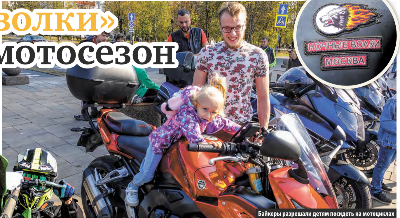
Байкеры разрешили детям посидеть на мотоциклах

В прошлую субботу на центральной площади Московского собрались несколько десятков мотоциклистов. Они выстроили свои байки в ряд – так, что получилась своего рода выставка мототехники. Брутальные байкеры и их «железные кони» вызвали большой интерес: прохожие фотографировались с ними, интересовались особенностями моделей и образом жизни их владельцев. А детям позволялось не только взобраться на мотоцикл, но даже завести мотор.