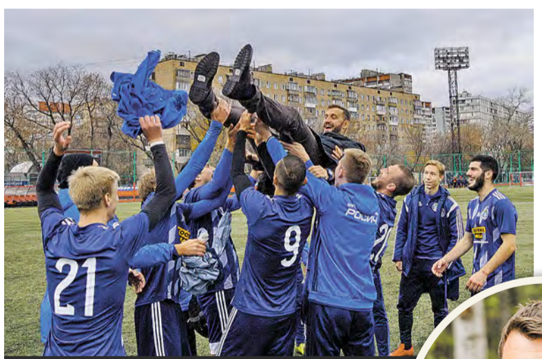
Футболисты со своим тренером после очередной победы

нам неоценимую помощь, отправив команду на сборы, где мы хорошо поработали.