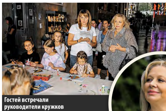
Гостей встречали руководители кружков