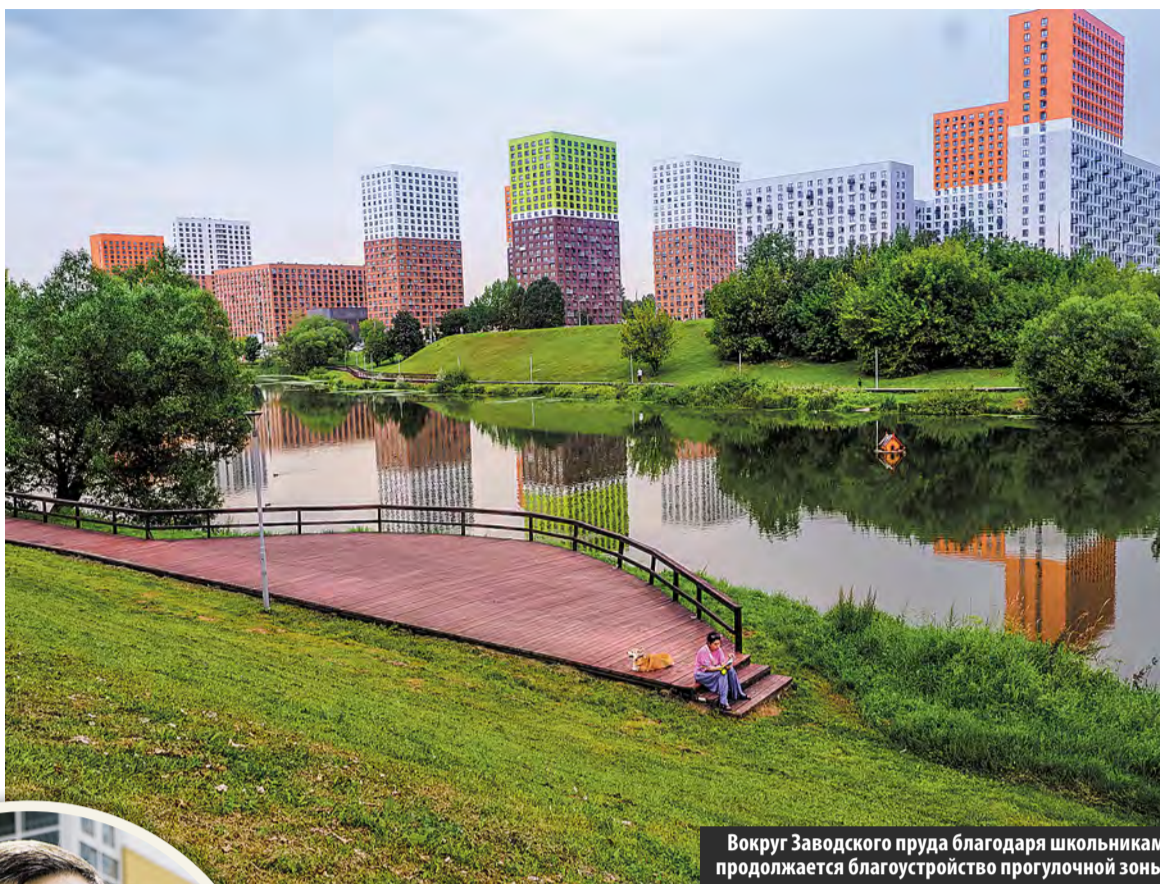
Вокруг Заводского пруда благодаря школьникам продолжается благоустройство прогулочной зоны

– Ваша кандидатская диссертация посвящена педагогической этике. Получается использовать научные наработки на практике? – Безусловно, поскольку это очень созвучно с курсом, в котором развивается современное среднее образование. Педагогическая этика – это прежде всего уважение к ребенку как к личности. За последние десятилетия школа как общественный институт претерпела большие изменения. Нет больше единой школьной формы, другая форма подведения итоговой аттестации. Но основное от-