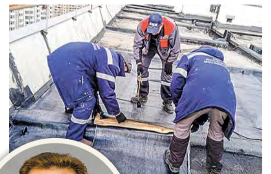
Ремонт рулонного ковра на многоэтажке

Масштабному ремонту крыш поселения предшествовали осмотр и выявление возможных проблем, например, мест протечек. Как только установилась благоприятная погода, бригады управляющей организации «Жилищник Московский» приступили к работе.