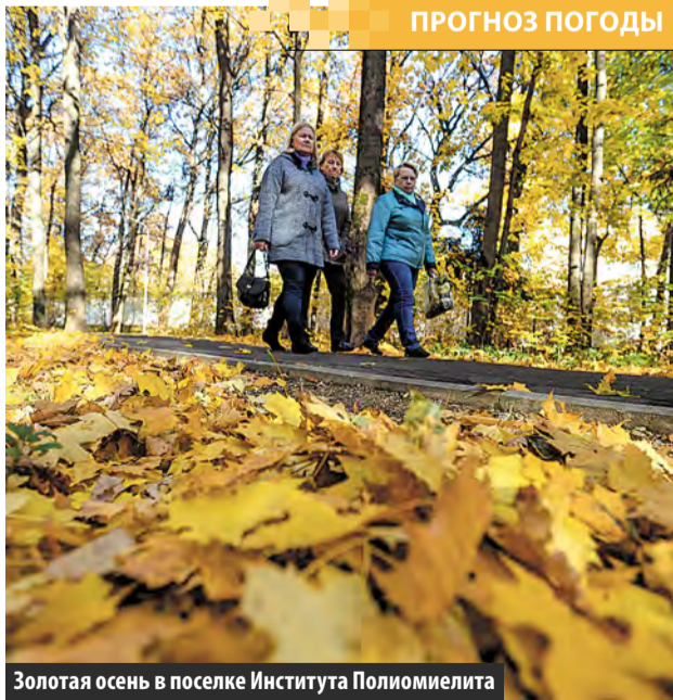
Золотая осень в поселке Института Полиомиелита