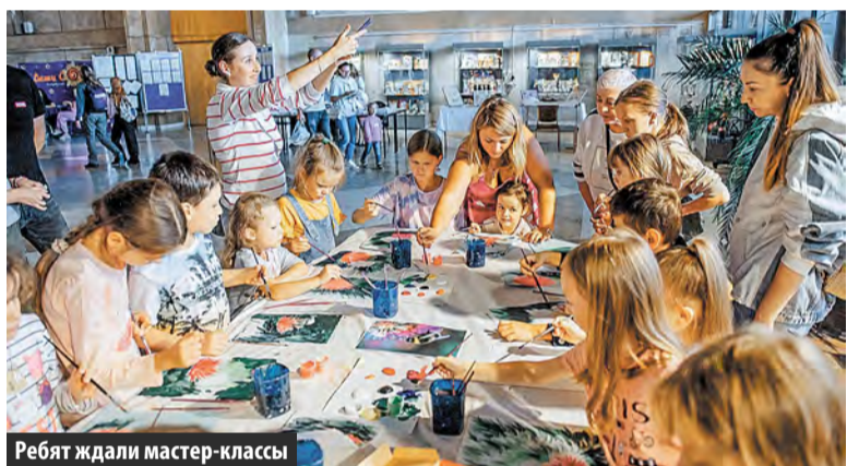
Ребят ждали мастер-классы

1,5 тысяч детей и взрослых. Почти в каждом направлении есть бесплатные места для льготников.