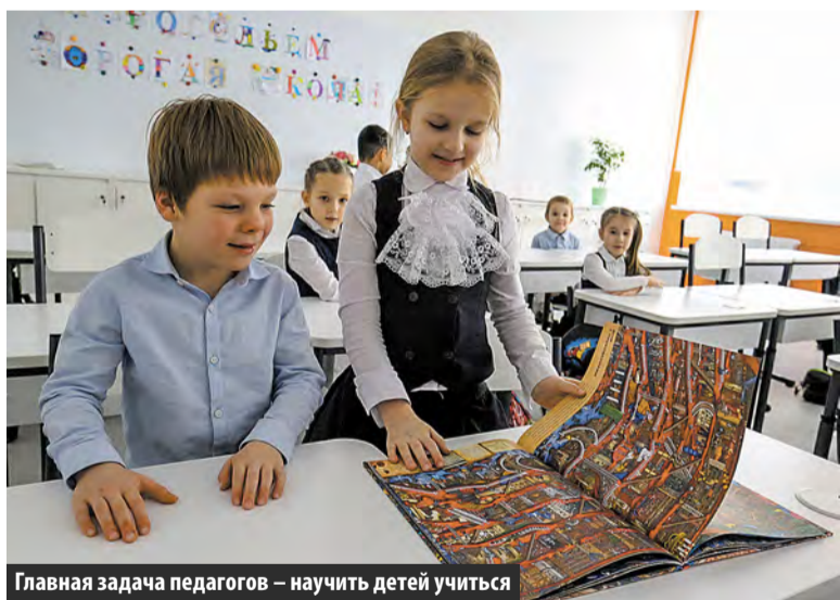
Главная задача педагогов – научить детей учиться

liche заключается именно в том, что дети наконец получили возможность развивать свою индивидуальность. Сегодня ребенок может выбрать то направление, в котором он хочет профессионально расти в будущем, получить углубленные знания по тем предметам, которые ему больше всего нужны, будь то точные науки, гуманитарные или естественно-научные дисциплины.