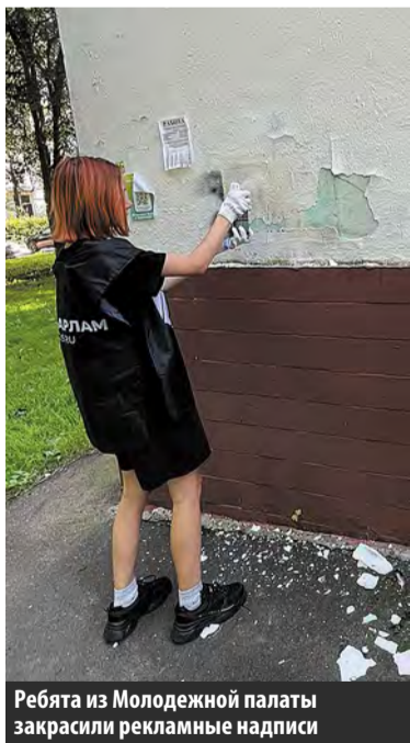
Ребята из Молодежной палаты закрасили рекламные надписи

Рейд «Безопасный Московский» прошел в 1-м микрорайоне.