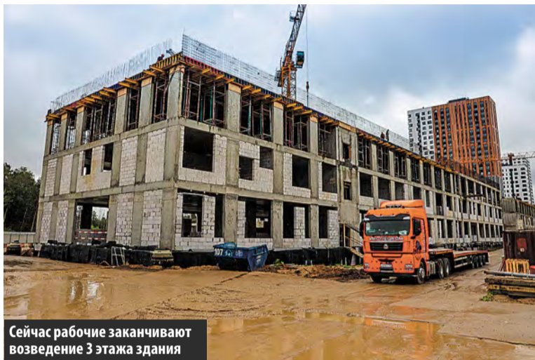
Сейчас рабочие заканчивают возведение 3 этажа здания

В микрорайоне Первый Московский город-парк полным ходом идет строительство школы и детского сада.