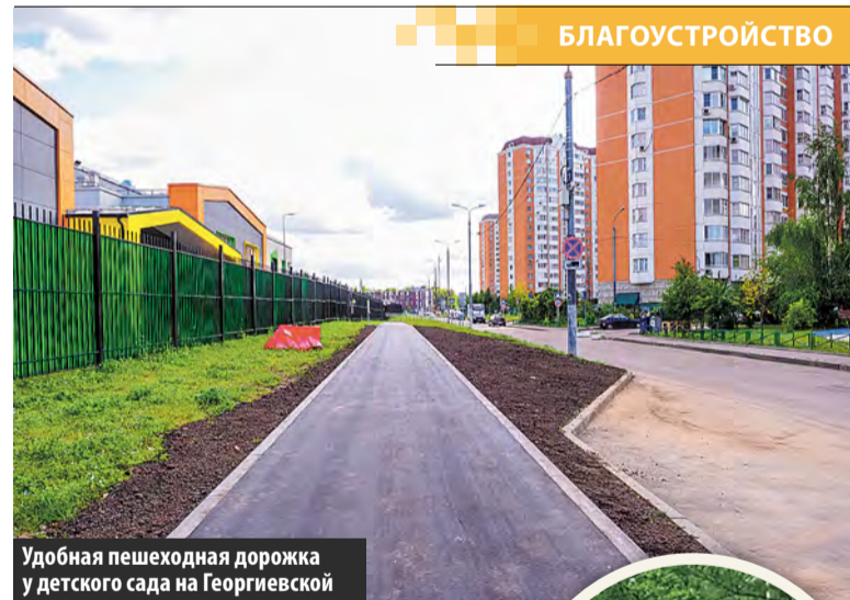
Удобная пешеходная дорожка у детского сада на Георгиевской