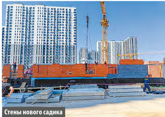
Стены нового садика

На территории 10-й фазы микрорайона Первый Московский город-парк продолжается возведение школы на 1100 учащихся и детского сада на 350 мест.