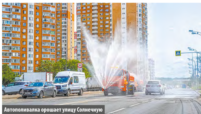
Автополивалька орошает улицу Солнечную

Из-за жаркой погоды городские службы приступили к аэрации воздуха. Для чего это делается, выяснил «МС».