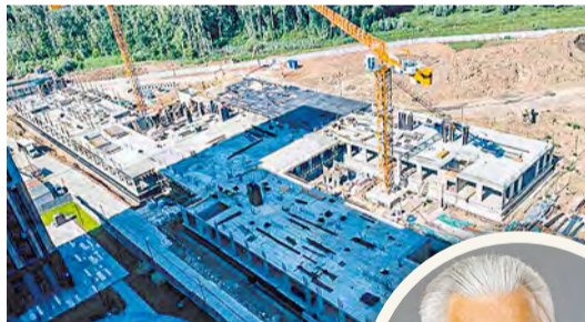
А так выглядит будущая школа

Специалисты завершают устройство пола, стен и перекрытий подвала, дренажной системы в будущем здании садика. Наружные стены первого этажа уже готовы на треть. Также ведутся монолитные работы на первом этаже будущей школы.