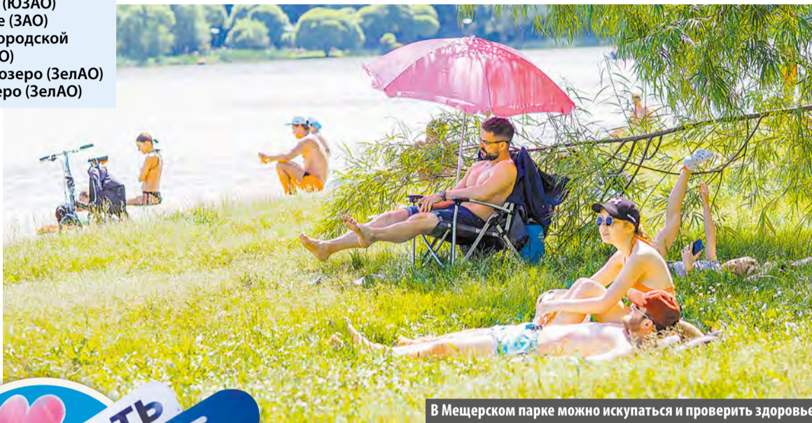
В Мещерском парке можно искупаться и проверить здоровье

17 и 18 июня в столице открылся купальный сезон. Рассказываем, где жителям Московского отдохнуть у воды.