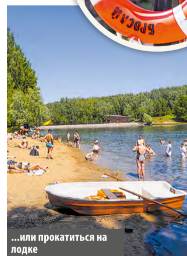
...или прокатиться на лодке