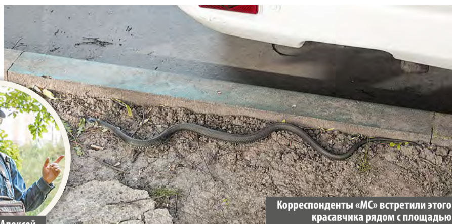
Корреспонденты «МС» встретили этого красавчика рядом с площадью

– Ужа можно отличить от гадюки по большому круглому желтому щитку на голове, – рассказал натуралист. – Зра-