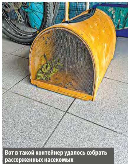
Вот в такой контейнер удалось собрать рассерженных насекомых