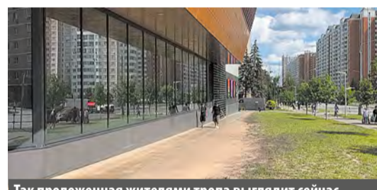
Так проложенная жителями тропа выглядит сейчас...

Протоптанная тропинка у торгового центра «Столица» в скором времени превратится в пешеходную зону с местом тихого отдыха.