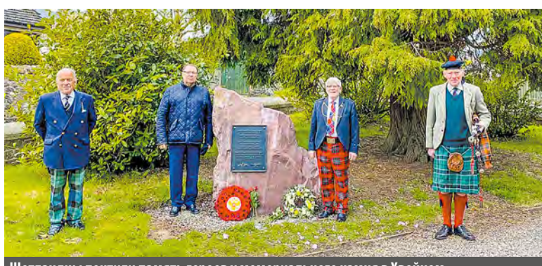
Шотландцы почтили память героев у мемориального камня в Хвойном