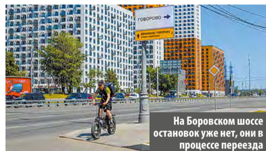
На Боровском шоссе остановок уже нет, они в процессе переезда

Остановочные пункты у станции метро «Говорово» вблизи микрорайона Татьяна парк переедут на дублер Боровского шоссе. Об этом сообщили в Департаменте транспорта столицы.