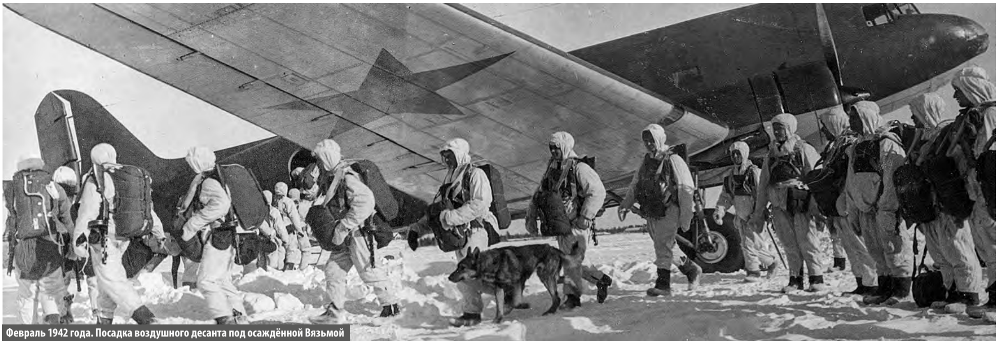
Февраль 1942 года. Посадка воздушного десанта под осаждённой Вязьмой