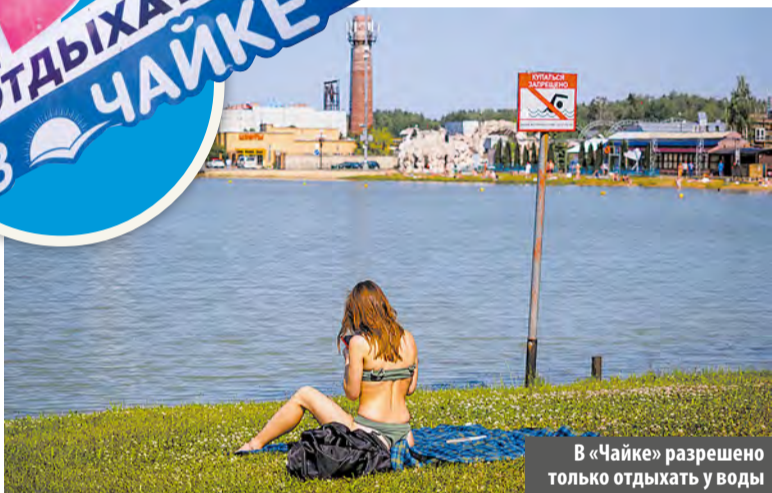
В «Чайке» разрешено только отдыхать у воды