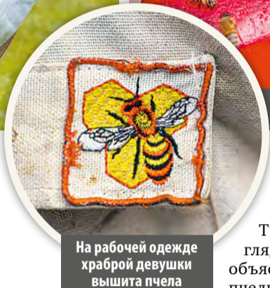
На рабочей одежде храброй девушки вышита пчела