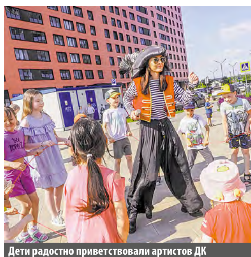
Дети радостно приветствовали артистов ДК

Если вам нужна помощь, обращайтесь по телефону Единой службы спасения – 112