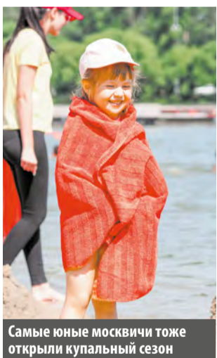
Самые юные москвичи тоже открыли купальный сезон

Лето в этом году обещают жаркое, и погода подтверждает прогнозы синоптиков – столбик термометра уже доходит до +28 градусов. В такое время хорошо находиться где-нибудь на пляже. В 2023 году Роспотребнадзор одобрил 10 мест для купания в столице. Также в этом сезоне в Москве будут работать 39 зон отдыха без купания. Корреспонденты «МС» осмотрели ближайшие к Московскому.