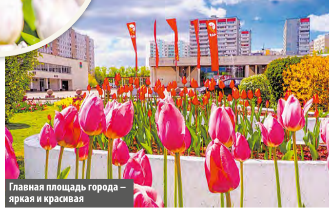
Главная площадь города – яркая и красивая