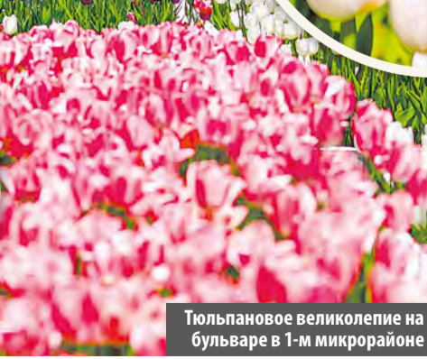
Тюльпановое великолепие на бульваре в 1-м микрорайоне