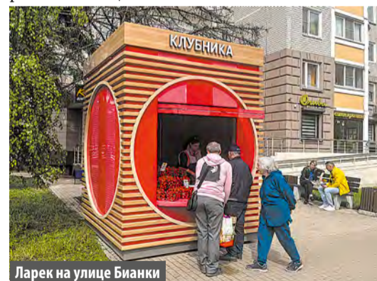
Ларек на улице Бианки

«Клубничный фестиваль проводится в Москве на протяжении восьми лет и стал для города доброй традицией. Он пользуется большой популярностью у жителей столицы и привлекает региональных участников-аграриев. В этом году для удобства продавцов и покупателей представлены новые торговые конструкции. Их можно узнать по красно-розовому цвету и деревянным элементам в отделке», – говорится в сообщении.