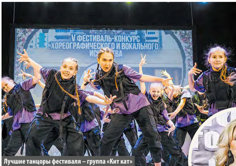
Лучшие танцоры фестиваля – группа «Кит кат»

ставили вокальный номер, и это больше соответствовало правилам конкурса. Так что все справедливо!