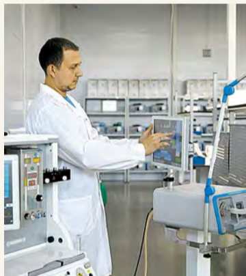
Медики провели исследования более 500 отечественных препаратов

Производство лекарств и медицинских изделий в Москве выросло почти в 1,5 раза. В первом квартале года столичные компании произвели на 43,7 процента больше продукции, чем за тот же период прошлого года. Об этом сообщил в своем телеграм-канале Сергей Собянин.