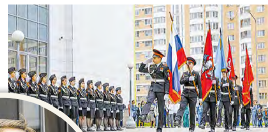
Школа № 2120 – рекордсмен по выпускникам

Рекордсменом, как и ожидалось, стала школа № 2120. Ее стены в этом году покинули 268 одиннадцатиклассников. Праздничные мероприятия проходили 22 и 23 мая сразу на трех образовательных площадках учебного учреждения.