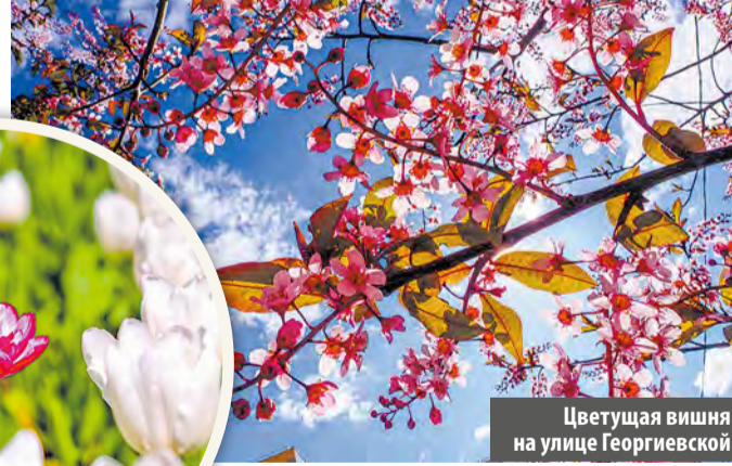
Цветущая вишня на улице Георгиевской