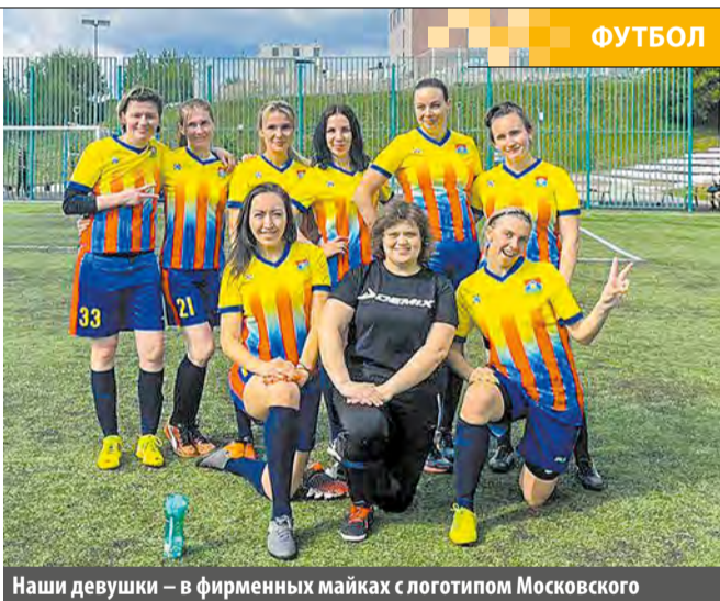
Наши девушки – в фирменных майках с логотипом Московского