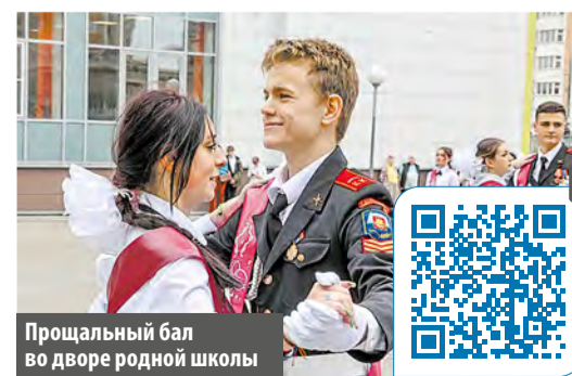
Прощальный бал во дворе родной школы