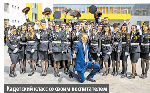
Кадетский класс со своим воспитателем

Из средних образовательных учреждений Московского в этом году выпустились 630 учеников. Последние звонки отзвучали во всех четырех школах поселения.