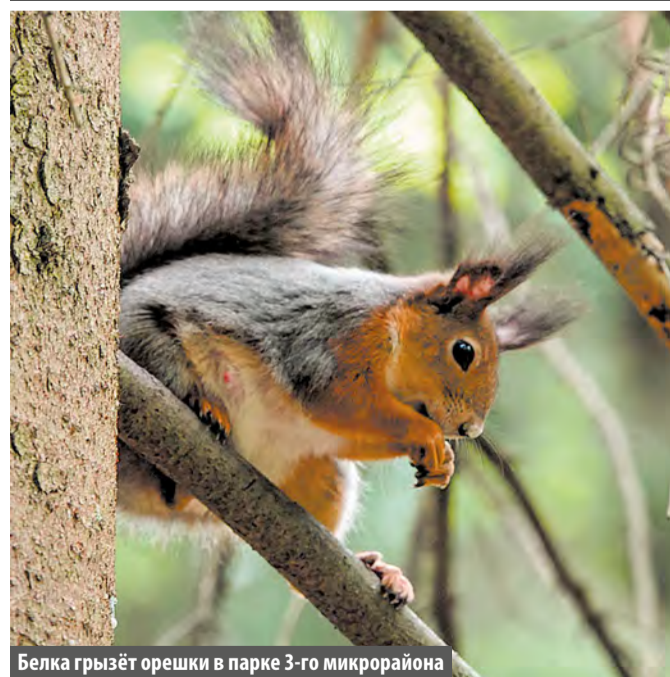
Белка грызёт орешки в парке 3-го микрорайона