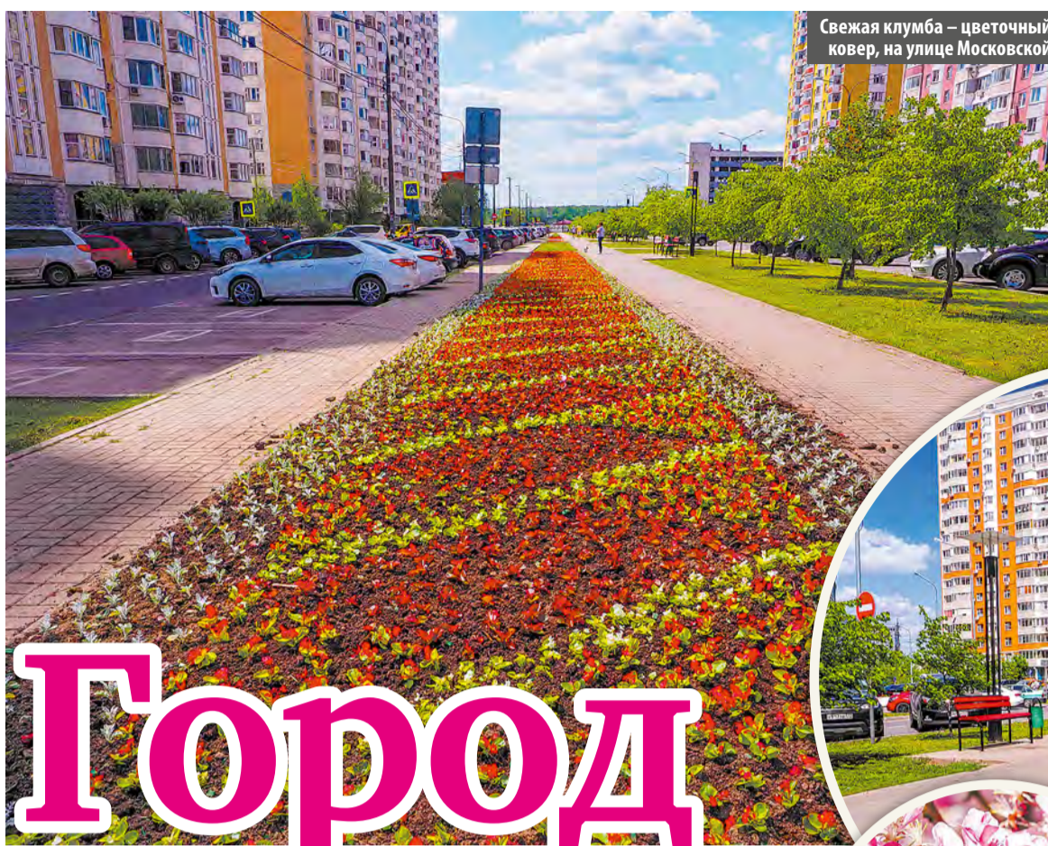
Свежая клумба – цветочный ковер, на улице Московской

Для клумб специалисты выбирают проверенные в наших климатических условиях саженцы: вербену и виолу, герань, канны, петунию, несколько видов тагетесов, колиус, душистый табак и однолетние георгины.