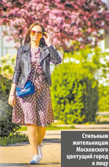
Стильным жителям Московского цветущий город к лицу