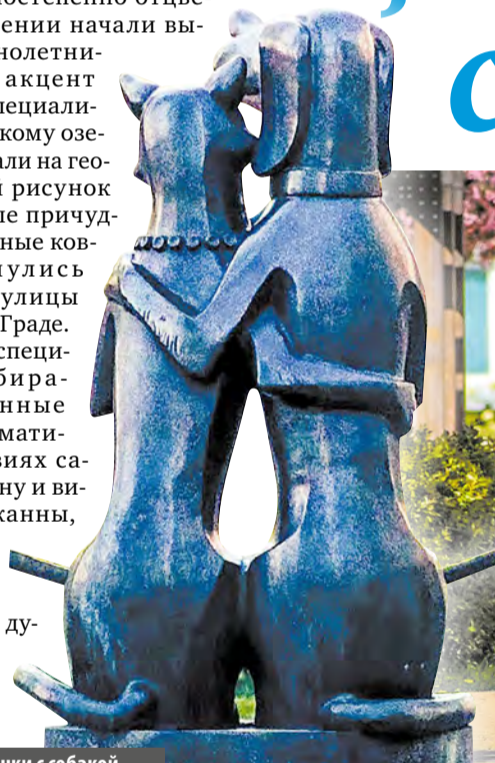
У скульптуры кошки с собакой жители загадывают желания