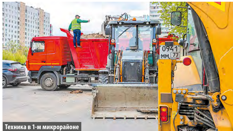
Техника в 1-м микрорайоне

На момент подготовки номера благоустройство проходило у домов №№ 24, 23г и 31 и на бульваре 1-го микрорайона. На сегодняшний день частично завершена укладка асфальтобетонного покрытия на тротуарах и проезжей части. Установлены технические бордюрные камни. Полностью закончить работы специалисты планируют до 25 августа.