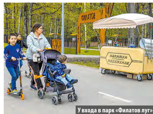
У входа в парк «Филатов луг»

В парке «Филатов луг» установили первый передвижной лоток с десертами. Теперь у любителей прогулок появилась возможность не только отдохнуть на природе, но и перекусить вкусным лакомством.