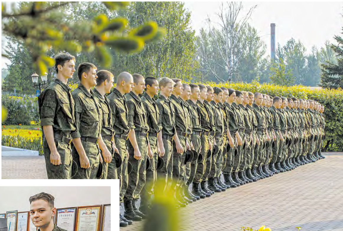
Получить подробную информацию о службе можно на аллее Витте или в Московском