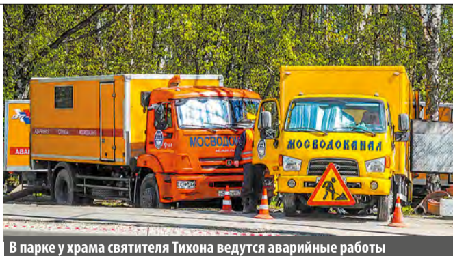
В парке у храма святителя Тихона ведутся аварийные работы

«27 апреля 2023 г. в АО «Мосводоканал» поступила заявка об излиянии из люка канализационного колодца по адресу: г. Москва, Новомосковский административный округ, г. Московский, ул. Никитина, 2. Сотрудниками аварийной службы компании были проведены первоочередные мероприятия для обеспечения бесперебойного водоотведения; задейство-