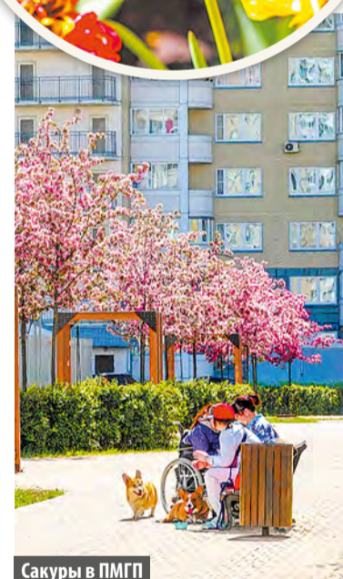
Сакуры в ПМГП