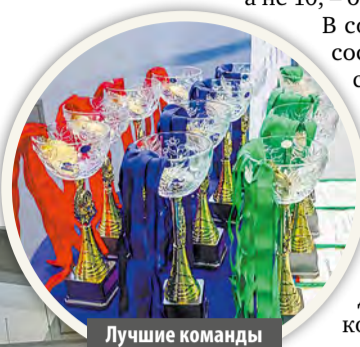
Лучшие команды получили кубки и медали