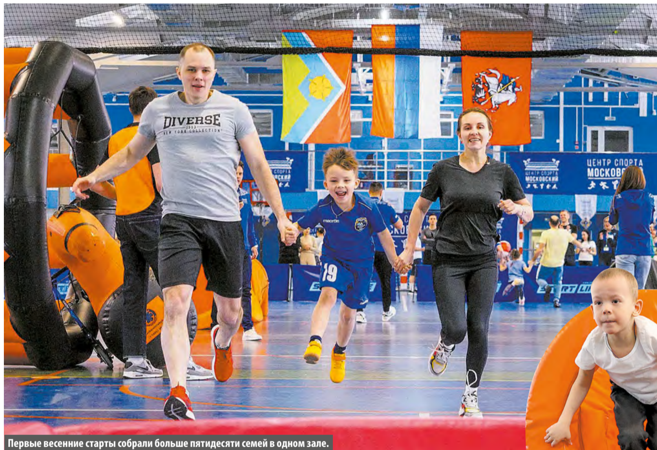
Первые весенние старты собрали больше пятидесяти семей в одном зале.

Больше полусотни семей из Московского прошли эстафету на «Веселых стартах»