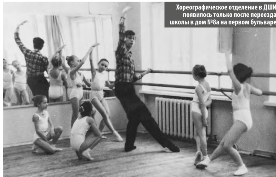
Хореографическое отделение в ДШИ появилось только после переезда школы в дом №8а на первом бульваре

Одна из первых в области переименована в Детскую школу искусств с открытием двух новых отделений (хореографического и художественного).