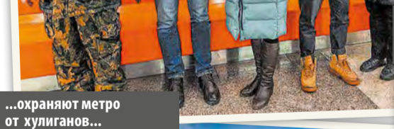
...охраняют метро от хулиганов...