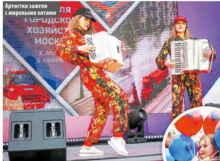
Артистки зажгли с мировыми хитами для городского хозяйства Москвы. К Мэру с любовью.