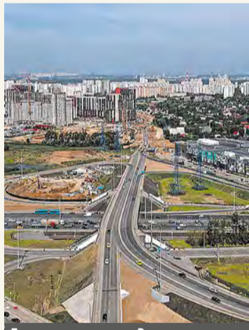
Дорожная развязка у Румянцево-парка

Специалисты провели реконструкцию Калужского шоссе, построили дублер Калужского шоссе – автодорогу Марьино – Саларьево, открыли движение по трем участкам магистрали Солнцево – Бутово – Варшавское шоссе и еще нескольким трассам, возвели транспортные развязки и новые выезды из населенных пунктов на магистрали.