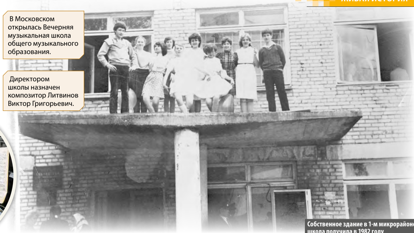
Собственное здание в 1-м микрорайоне школа получила в 1982 году