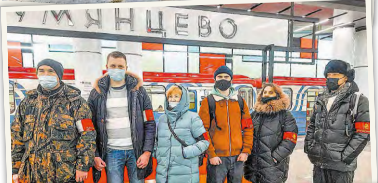
Прекрасные представительницы дружины