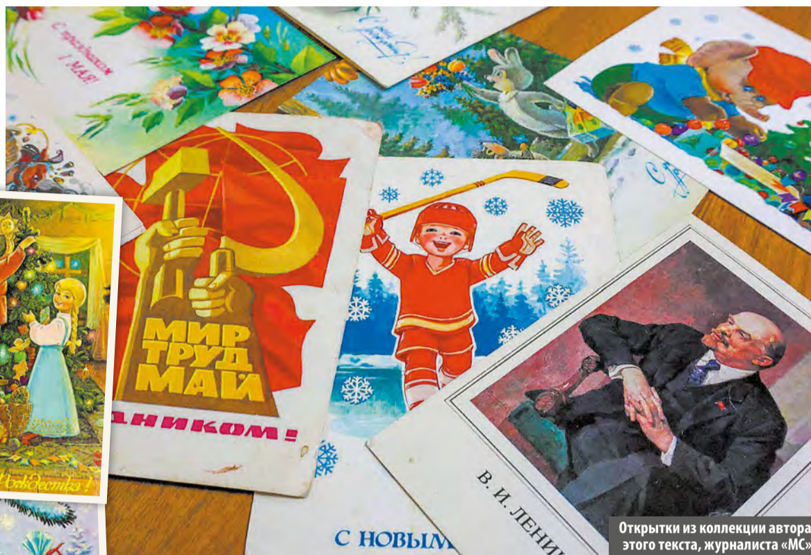
Открытки из коллекции автора этого текста, журналиста «МС»

Коллекционирование почтовых открыток называется «филокартия». Термин образован