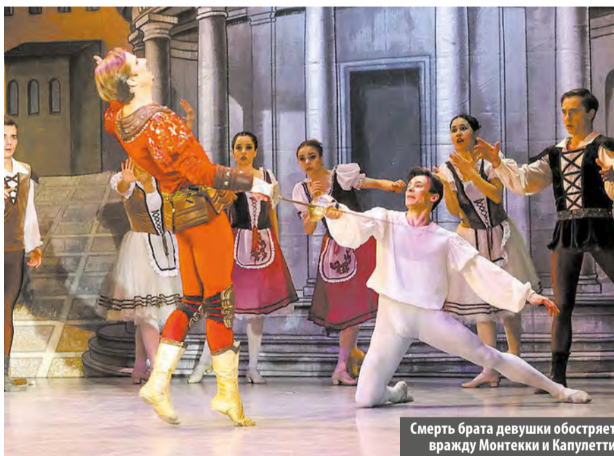
Смерть брата девушки обостряет вражду Монтекки и Капулетти