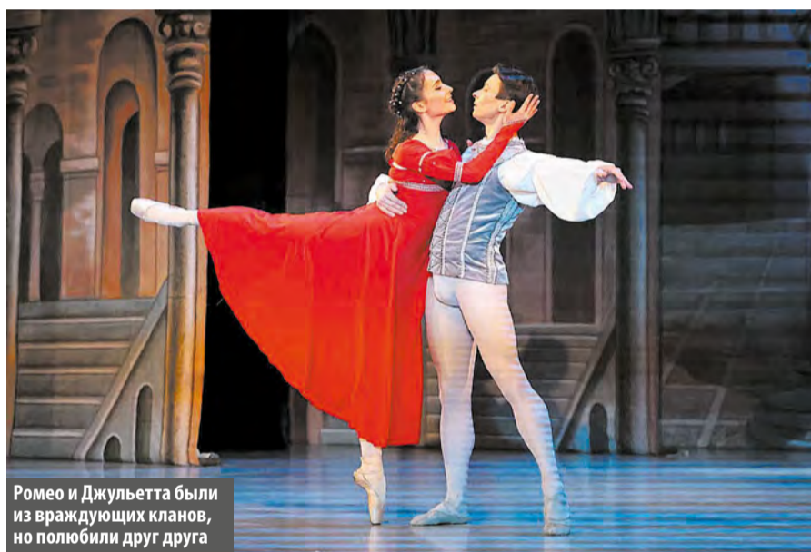
Ромео и Джульетта были из враждующих кланов, но полюбили друг друга