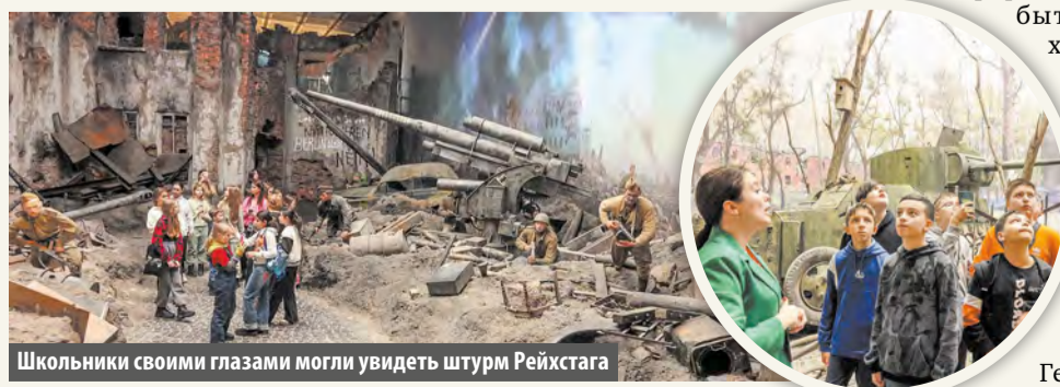
Школьники своими глазами могли увидеть штурм Рейхстага

— Многие ученики после рассказа экскурсовода подходили к учителю со словами благодар-