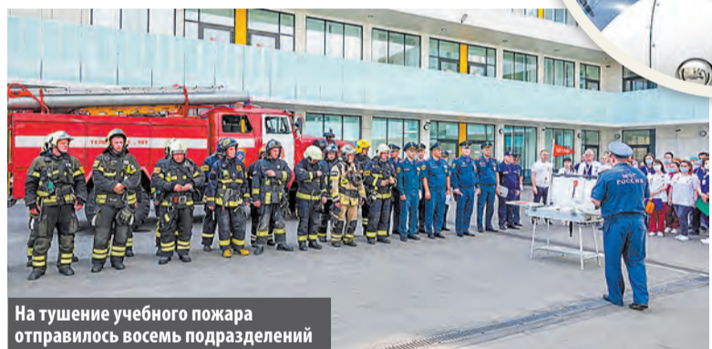
На тушение учебного пожара отправилось восемь подразделений

Светлана ГАВРИЛОВА