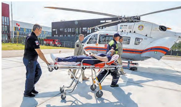
Пожарные эвакуируют «пострадавшего» на носилках

– Каждый день мы эвакуируем около 50 человек в городские медицинские учреждения с инсультами, сердечными приступами, после ДТП, –