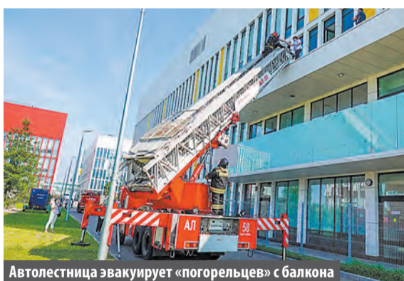
Автолестница эвакуирует «погорельцев» с балкона