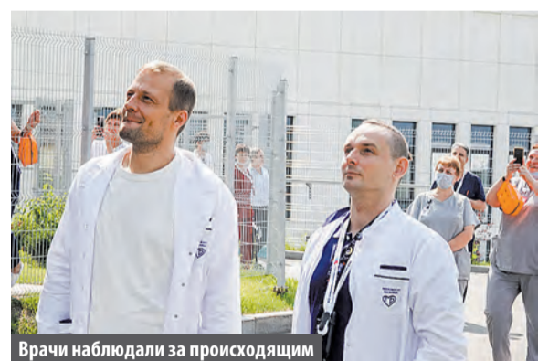
Врачи наблюдали за происходящим