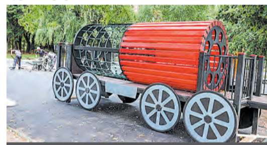
На площадке в 1-м микрорайоне появится красный паровозик