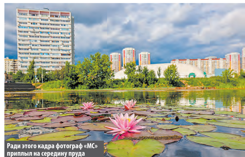
Ради этого кадра фотограф «МС» приплыл на середину пруда