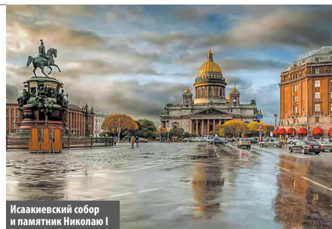
Исаакиевский собор и памятник Николаю I