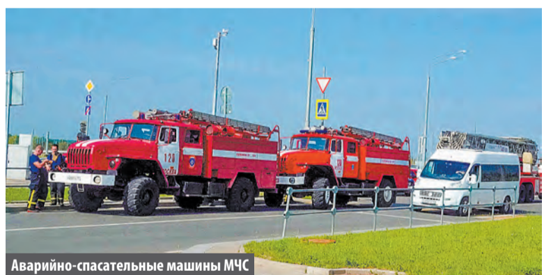
Аварийно-спасательные машины МЧС