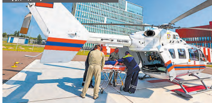
Санитарный вертолет – оперативное средство оказания медицинской помощи в труднодоступных местах