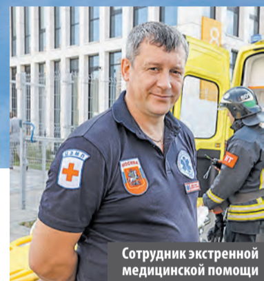
Сотрудник экстренной медицинской помощи

– Мы ежемесячно проводим пожарно-тактические учения на разных объектах в ТиНАО. В первую очередь на социально значимых: в учреждениях образования, здравоохранения, на производствах, в метрополитене. Больница в Коммунарке – один из крупнейших