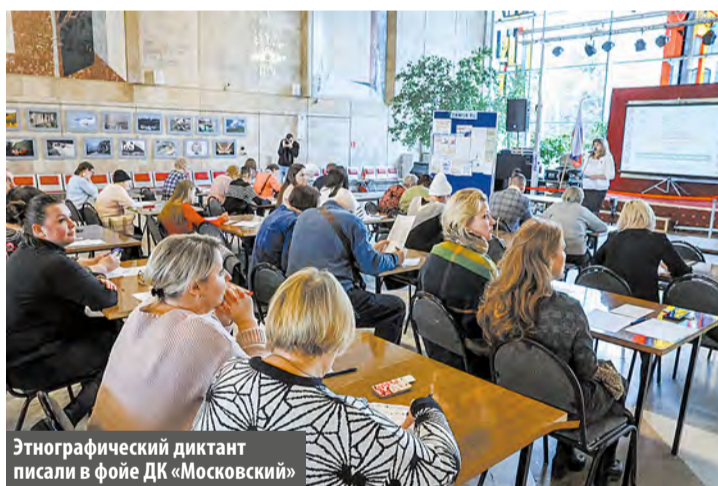
Этнографический диктант писали в фойе ДК «Московский»

– Пошехонье – это сыр такой есть, недавно покупала, – убеждает миниатюрная пожилая