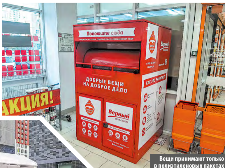
Вещи принимают только в полиэтиленовых пакетах

В Московском появились контейнеры для сбора ненужных вещей. Что это и как работает экологическая инициатива, накануне Всемирного дня вторичной переработки, 15 ноября, выяснили корреспонденты «МС».