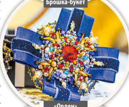
«Орден» для модниц