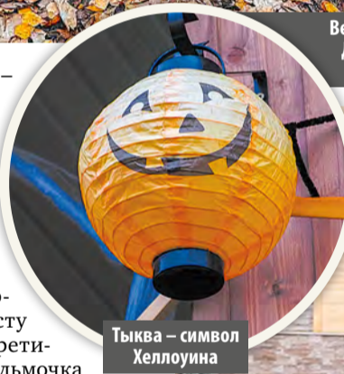
Тыква – символ Хеллоуина

– Такие праздники объединяют людей и позволяют всем ближе познакомиться и сдружиться, – говорит Стани-