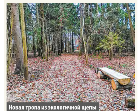
Новая тропа из экологичной щепы

Экотропа из древесной щепы появилась вблизи коттеджного поселка Бристоль.