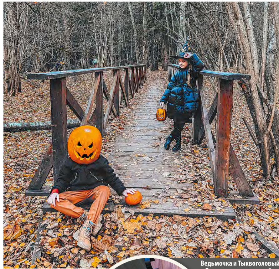
Ведьмочка и Тыквоголовый Джек на мосту в парке 3-го микрорайона

В субботу, 29 октября, в СНТ «Фея-Лапшинка» прошел веселый семейный Хеллоуин с тыквами и летучими мышами, а 31 октября жители поселения отмечали праздник, наряжаясь в карнавальные костюмы.