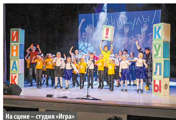
На сцене – студия «Игра»

2 ноября во Дворце культуры «Московский» состоялся VIII детский фестиваль, посвященный осенним выходным.