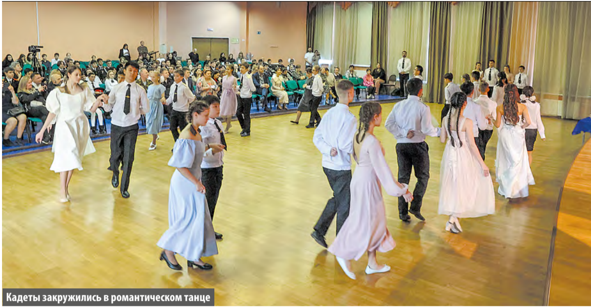
Кадеты закружились в романтическом танце