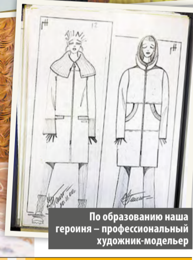
По образованию наша героиня – профессиональный художник-модельер

выставки рукоделия, которые почти каждый месяц проходят в Москве. Любовавшись изделиями коллег, подбирала камни для будущих собственных украшений.