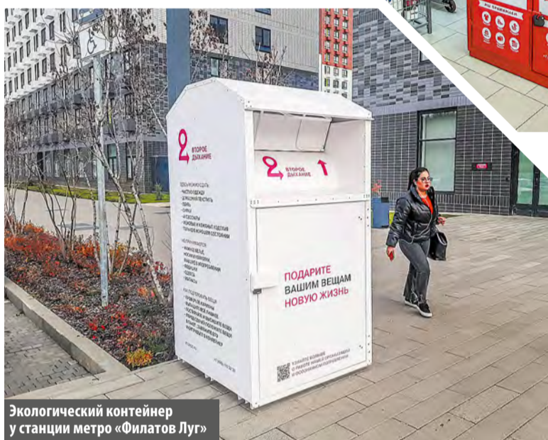
Экологический контейнер у станции метро «Филатов Луг»

Например, контейнер «Второе дыхание», недавно установленный у метро «Филатов Луг», принимает чистую одежду, домашний текстиль, обувь, сумки и другие аксессуары. Белорозовые ящики фонда установлены в ТРЦ «Саларис», а также неподалеку от метро «Говорово», в магазине «Спортмастер». Как объяснили в организации, часть собранных вещей передается нуждающимся, малоимущим семьям и прочим слабо защищенным группам населения. Другая – «возвращается в эконо-