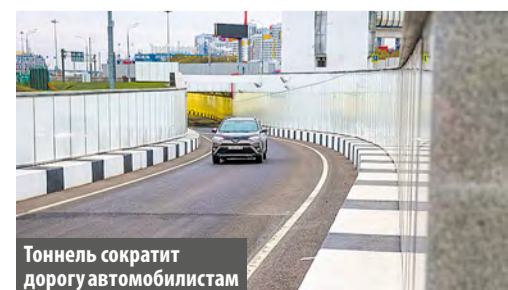
Тоннель сократит дорогу автомобилистам