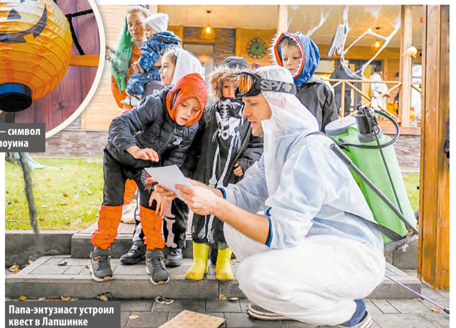
Папа-энтузиаст устроил квест в Лапшинке