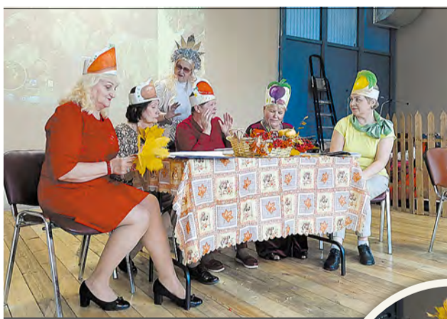
Артистки серебряного возраста сыграли овощей