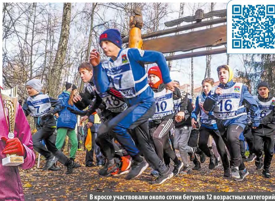
В кроссе участвовали около сотни бегунов 12 возрастных категорий

говым соревнованиям, с теми, кто еще совсем новичок в беге. – Я бегаю, когда есть время. Иногда через день по пять километров, а порой из-за загруженности на работе получается выбраться на пробежку всего раз в месяц. Но очень люблю