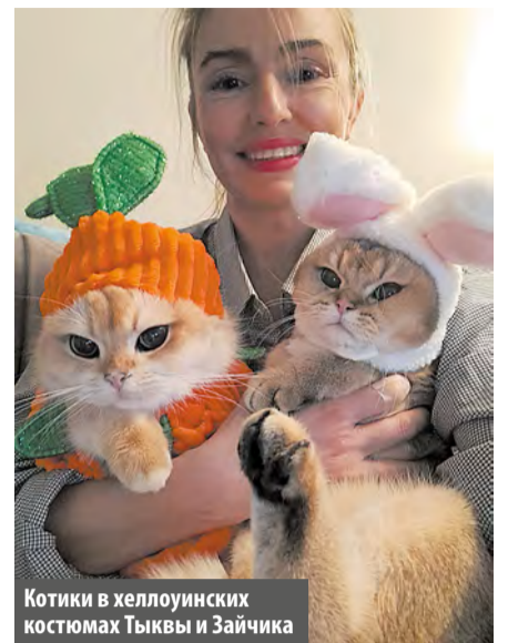
Котики в хеллоуинских костюмах Тыквы и Зайчика

слав. – В этом году мы уже проводили Масленицу, а также несколько праздников летом – детские эстафеты, день Нептуна. Теперь планируем дружно отметить Новый год.