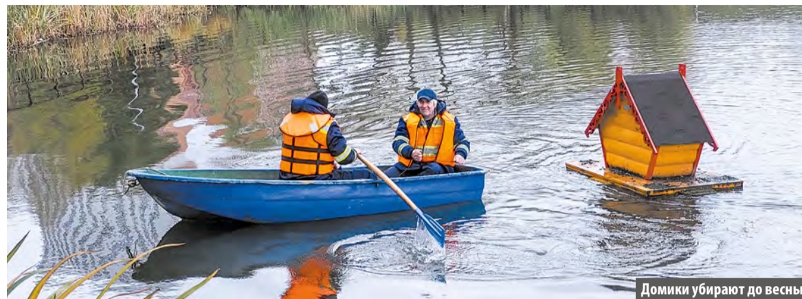
Домики убирают до весны

С конца октября специалисты Мосводостока, предприятия Комплекса городского хозяйства Москвы, приступили к подъему на берег птичьих жилищ из городских прудов.