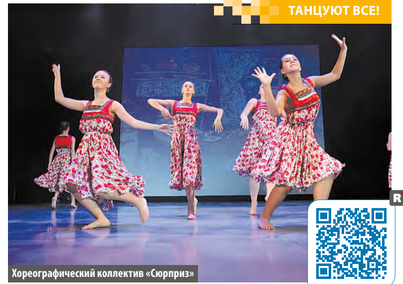
Хореографический коллектив «Сюрприз»

Светлана ГАВРИЛОВА