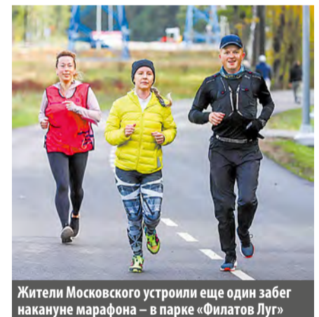
Жители Московского устроили еще один забег накануне марафона – в парке «Филатов Луг»

это совсем другой уровень, «с дивана» его не пробежишь.