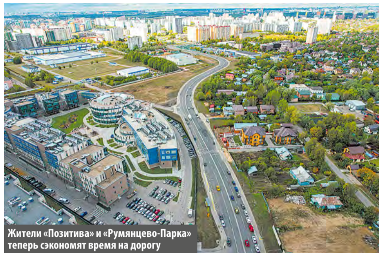
Жители «Позитива» и «Румянцево-Парка» теперь сэкономят время на дороге

Запущено движение по новой трассе, которая связывает две крупные автомагистрали и проходит через Проектируемый проезд №6492 и Родниковую улицу.