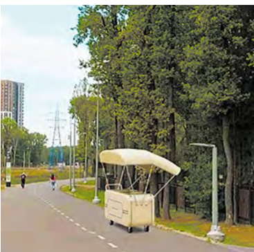
Теперь у гуляющих по велодорожке сладкое лакомство будет «под рукой»