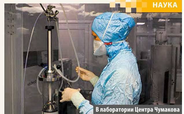
В лаборатории Центра Чумакова