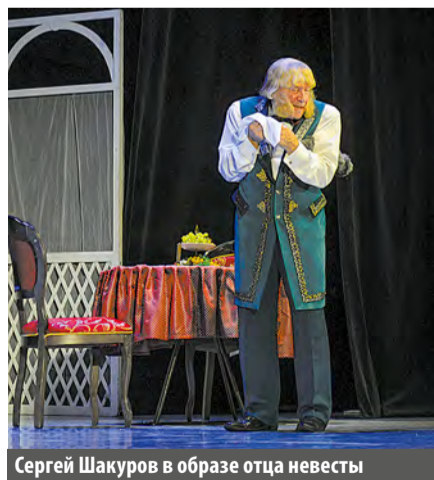
Сергей Шакуров в образе отца невесты