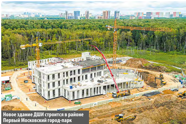
Новое здание ДШИ строится в районе Первый Московский город-парк