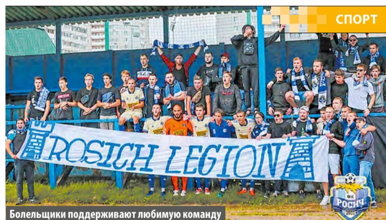
Болельщики поддерживают любимую команду