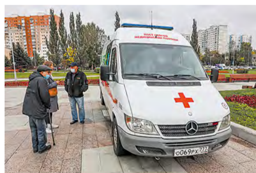
Так мобильная вакцинация проходила в прошлом году в соседнем с Московским микрорайоне Солнцево

Мобильные пункты вакцинации начали работу в Москве 19 сентября. Ежедневно у метро, МЦК и железнодорожных станций привиться от гриппа можно с 8:00 до 20:00 по будням, с 9:00 до 18:00 по субботам, с 9:00 до 16:00 по воскресеньям. А пройти вакцинацию в главном магазине города ГУМе можно будет ежедневно с 10:00 до 21:00. При себе необходимо иметь паспорт гражданина Российской Федерации и полис ОМС (при наличии).