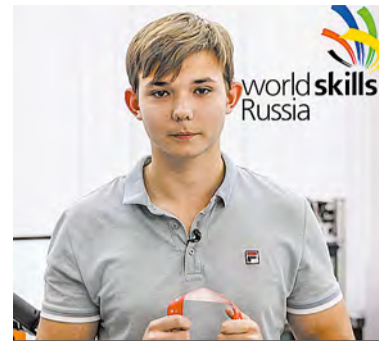
Юный веб-дизайнер — гордость Московского