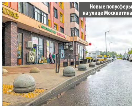
Новые полусферы на улице Москвитина