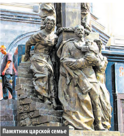
Памятник царской семье