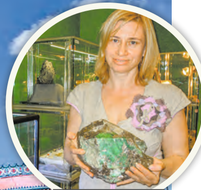
Легендарный изумруд, вес – 8 кг