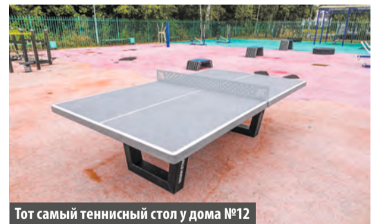
Тот самый теннисный стол у дома №12

В 1-м микрорайоне Московского появилась новая игровая зона для настольного тенниса.