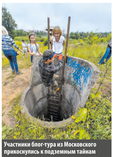
Участники блог-тура из Московского прикоснулись к подземным тайнам