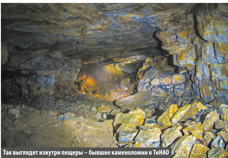
Так выглядят изнутри пещеры – бывшие каменоломни в ТиНАО