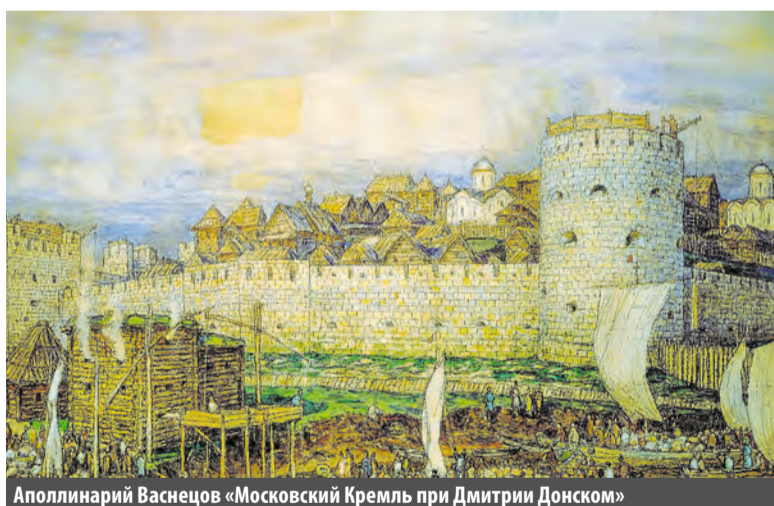
Аполлинарий Васнецов «Московский Кремль при Дмитрии Донском»