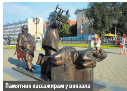
Памятник пассажирам у вокзала

Поднять 8-килограммовый изумруд. В уральских кладовых есть почти все ценные камни Земли. Ученые-минералоги считают, что ничто не сравнится с ними по красоте и глубине тона. И в это охотно веришь, побывав в Музее камнерезного искусства и в Уральском геологическом. В последнем есть attraction для туристов: сфотографироваться с 8-килограммовым изумрудом. С этим «камушком» снялась даже французская актриса Катрин Денев.