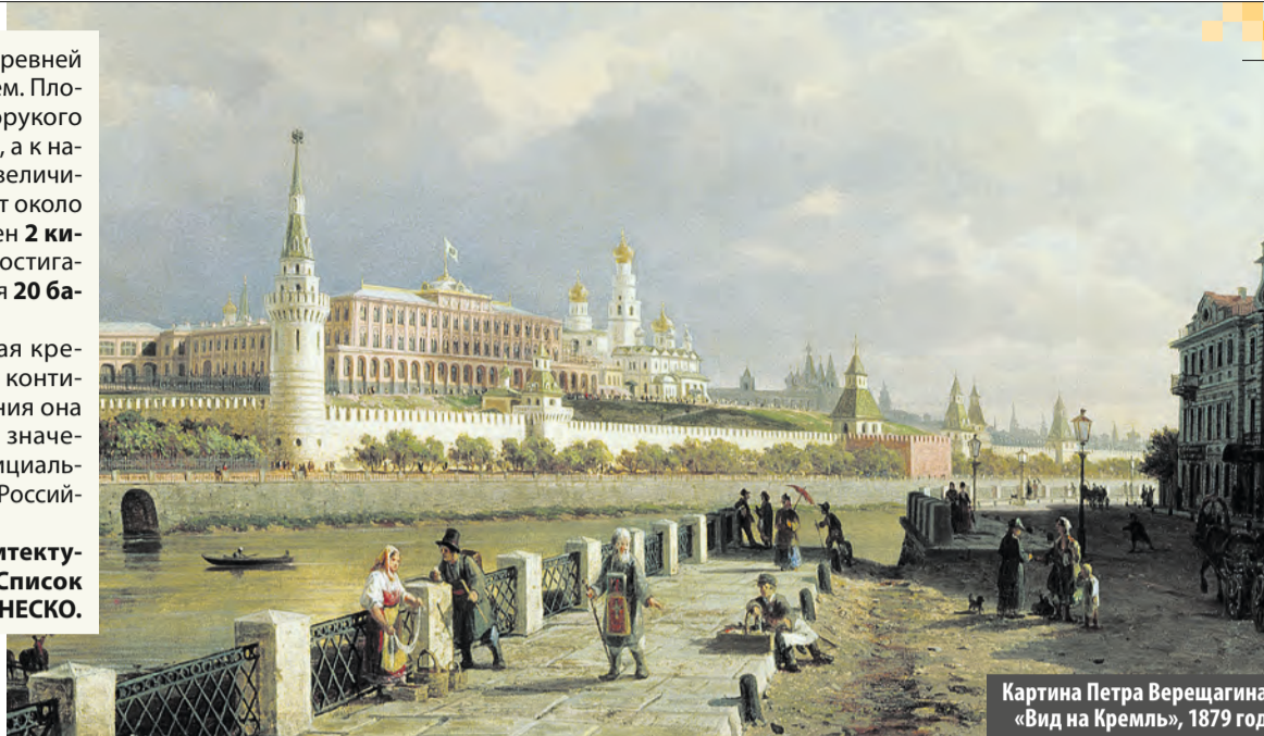
Картина Петра Верещагина «Вид на Кремль», 1879 год

Как уникальный памятник архитектуры и культуры Кремль внесен в Список объектов Всемирного наследия ЮНЕСКО.