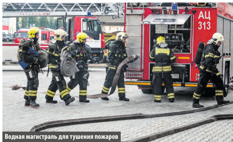
Водная магистраль для тушения пожаров

Для учителей, учеников и их родителей ситуация не вызывает дискомфорта, ведь подобные «репетиции» чрезвычайного происшествия проходят в школе в начале каждого учебного года. Все организованно