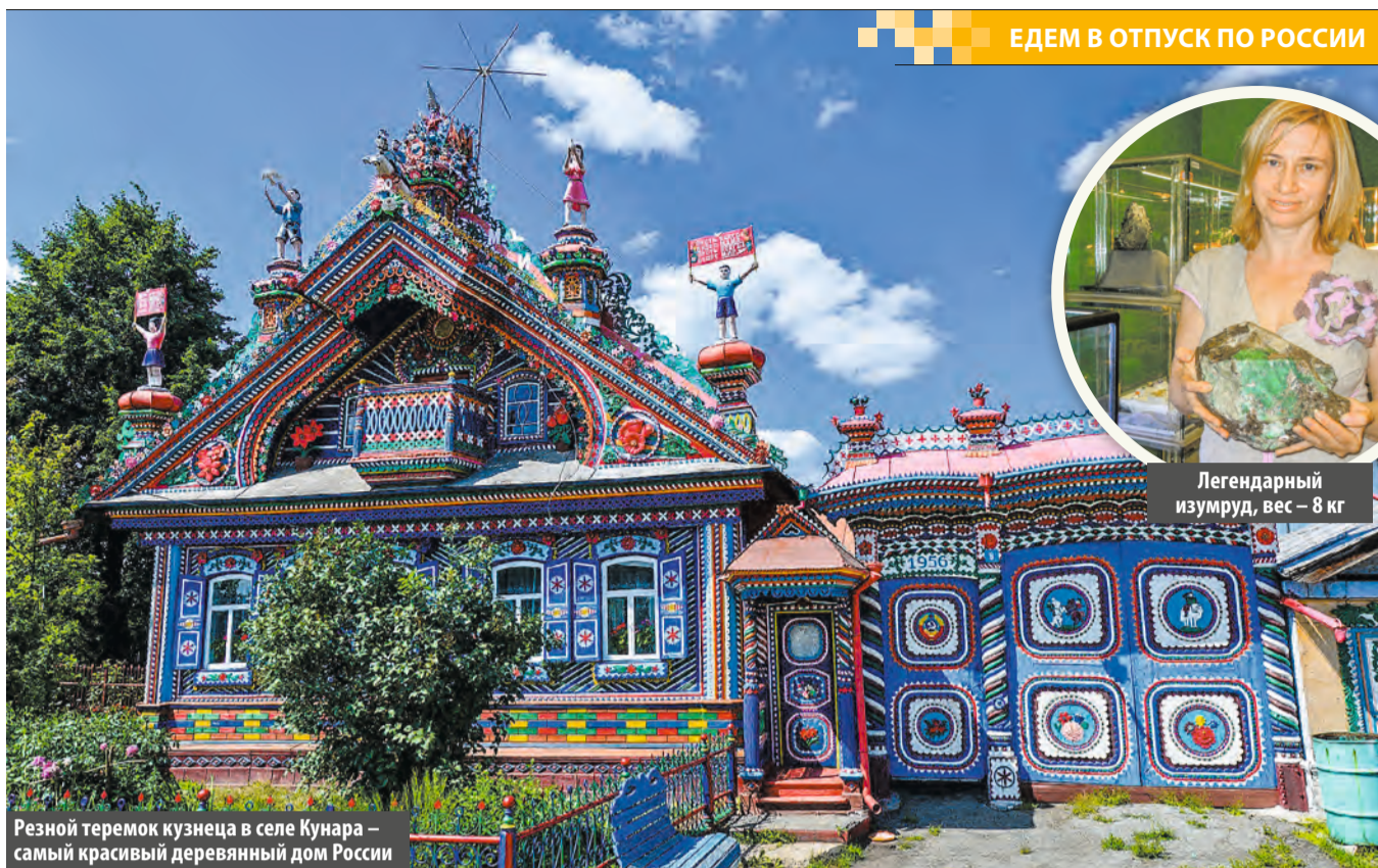
Резной теремок кузнеца в селе Кунара – самый красивый деревянный дом России