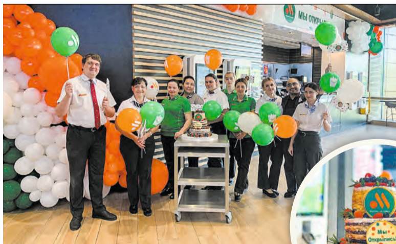
Так сотрудники отпраздновали открытие нового ресторана

В торговом центре «Столица» настоящий аншлаг. Кажется, что столько людей на фуд-корте второго этажа здесь не было давно. Несколько детей с подносами чуть ли не сбивают нас с ног, когда мы с коллегой подходим к кассам украшенного шариками ресторана.