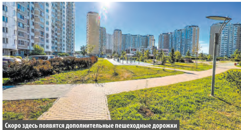
Скоро здесь появятся дополнительные пешеходные дорожки

Подведены итоги опроса о дополнительных проходах для детей и взрослых, стартовавшего 12 августа на официальном сайте администрации поселения Московский.