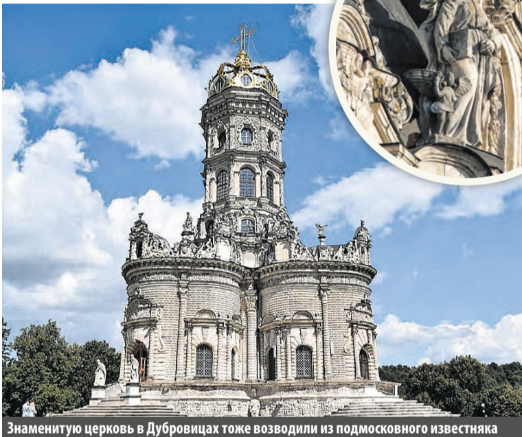
Знаменитую церковь в Дубровицах тоже возводили из подмосковного известняка