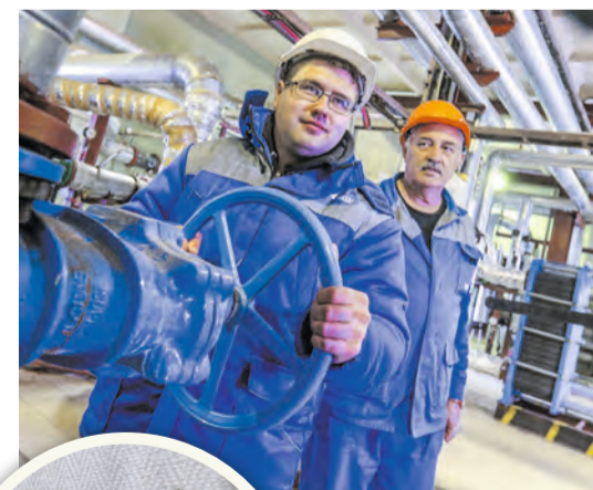
Коммунальщики готовы включить тепло, как только в домах похолодает