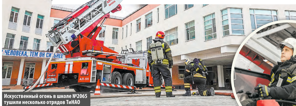
Искусственный огонь в школе №2065 тушили несколько отрядов ТиНАО

5 сентября в школе №2065 в 3-м микрорайоне Московского прошли пожарно-тактические учения.