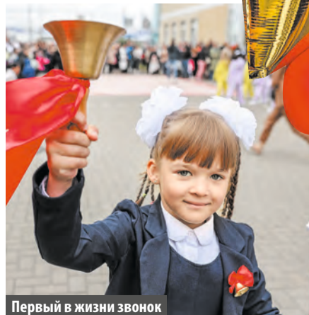
Первый в жизни звонок