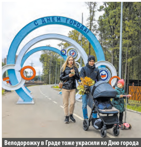
Велодорожку в Граде тоже украсили ко Дню города

10 и 11 сентября на ВДНХ пройдет фестиваль уличного творчества «Путешествие в красках». Трехмерные картины покажут российские художники. Гости ждут ралли ретроавтомобилей, открытые соревнования по скейтбордингу и выступление всадников Кремлевской школы верховой езды. В Зеленом театре можно будет увидеть музыкальную театральную постановку о люб-