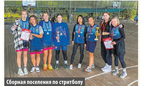
Сборная поселения по стритболу

Спортсмены из Московского привезли золото, серебро и бронзу с Окружных отборочных соревнований по стритболу.