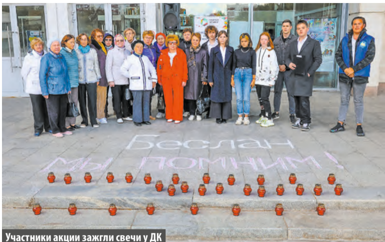
Участники акции зажгли свечи у ДК

С тех пор прошло 18 лет, но никто не забыл Беслан. Каждый год по всей стране зажигаются свечи, выпускаются в небо воздушные шары, приносятся цветы к мемориалам. Каждый год на главной площади Московского собираются неравнодушные жители, чтобы почтить память