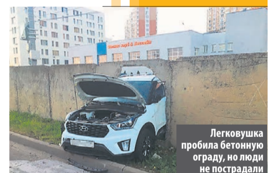
Легковушка пробила бетонную ограду, но люди не пострадали