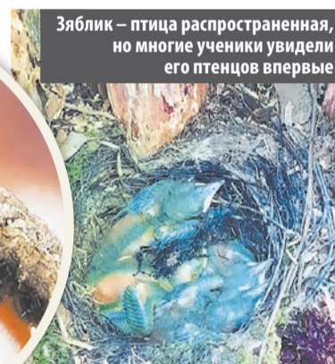
Зяблик – птица распространенная, но многие ученики увидели его птенцов впервые