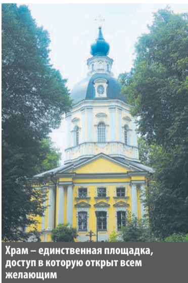
Храм – единственная площадка, доступ в которую открыт всем желающим