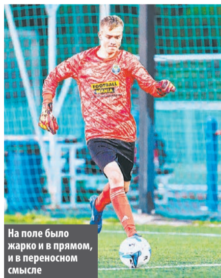
На поле было жарко и в прямом, и в переносном смысле

победу над принципиальным соперником из Зеленограда и вышел на первое место в турнирной таблице.