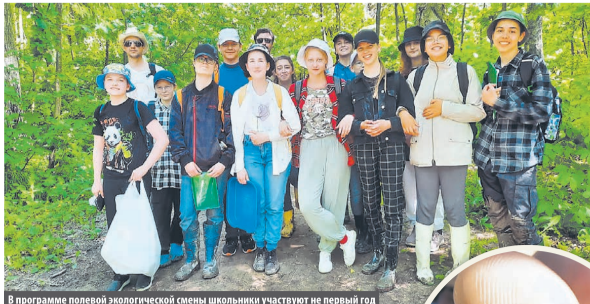
В программе полевой экологической смены школьники участвуют не первый год

Школьники из №2120 нашли краснокнижных животных