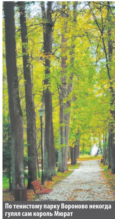
По тенистому парку Вороново некогда гулял сам король Мюрат

рал-губернатора Москвы во время наполеоновского нашествия, собственноручно поджег усадьбу в сентябре 1812 года, чтобы она