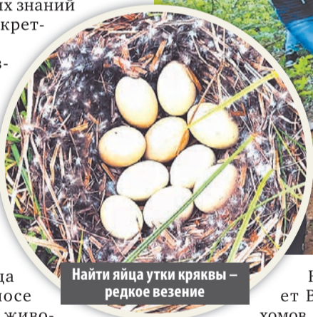
Найти яйца утки кряквы – редкое везение

Как отмечает Василий Пахомов, одна из главных задач экологической кампании – сформировать у ребят элементы экологическо-