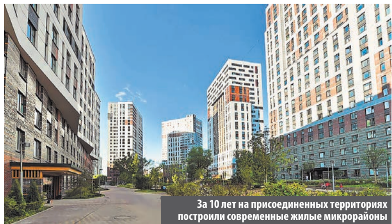
За 10 лет на присоединенных территориях построили современные жилые микрорайоны

P.S. Репортаж с концерта на Манежной площади с участием наших знаменитых земляков – артистов из Дворца культуры «Московский», читайте на стр. 3.