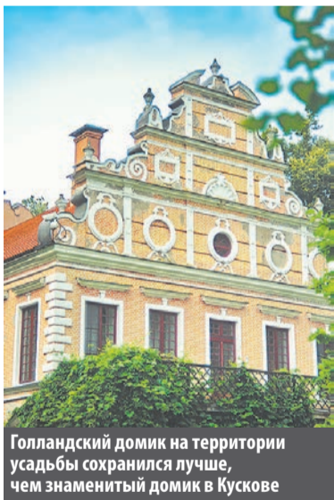
Голландский домик на территории усадьбы сохранился лучше, чем знаменитый домик в Кускове