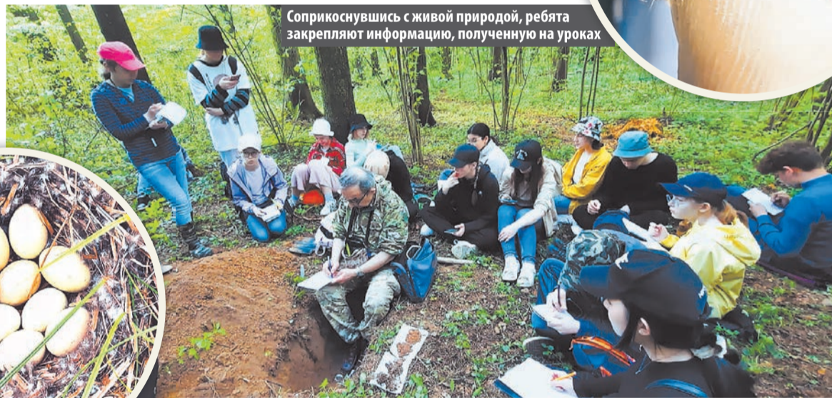
Соприкоснувшись с живой природой, ребята закрепляют информацию, полученную на уроках

Московский может гордиться своими парками и лесами, где еще сохранилась первозданная природа. Познакомиться с ее обитателями – редкими, краснокнижными видами птиц, животных и других представителей фауны – смогли ребята из школы №2120 во время занятий в полевой экологической смене, которая проходила июне.