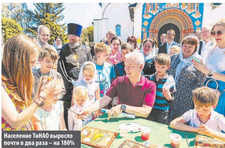
Население ТиНАО выросло почти в два раза – на 180%

«10 лет работы – это восемь станций классического метро, линия наземного метро МЦД-2 и 340 километров дорог, включая крупнейшие магистрали: фактически заново построенное Калужское шоссе и трассу Солнцево – Бутово – Варшавское шоссе, которая станет дублером МКАД. Еще через 10 лет в Новой Москве