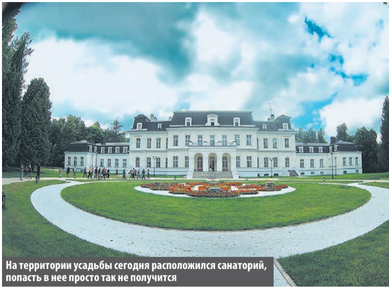
На территории усадьбы сегодня расположен санаторий, попасть в нее просто так не получится

Именно с именем Ростопчина связана легенда, благодаря кото-