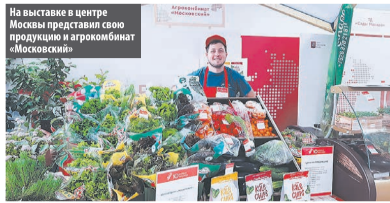
На выставке в центре Москвы представил свою продукцию и агрокомбинат «Московский»