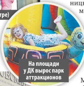
На площади у ДК вырос парк аттракционов

– Когда наши артисты выступают на Манежной площади, все