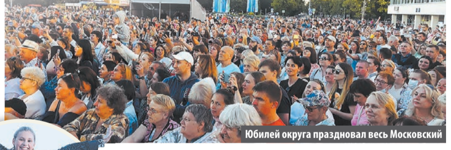
Юбилей округа праздновал весь Московский