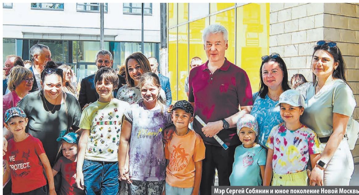
Мэр Сергей Собянин и юное поколение Новой Москвы

За 10 лет на территории новых округов построили школы и детские сады, многочисленные коммерческие объекты и жилые дома, современные медучреждения и первые станции метро