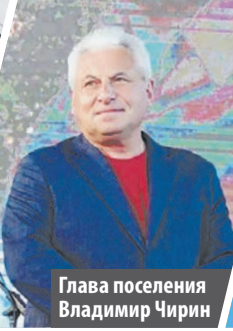
Глава поселения Владимир Чирин