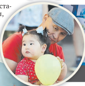
Праздник начался в 10 утра, закончился в 22 часа

На центральной площади у ДК установили аттракционы, батуты, киоски со сладостями. На летней сцене любой желающий мог сделать на память моментальное фото с праздничной символикой. Вечером начался концерт, в котором