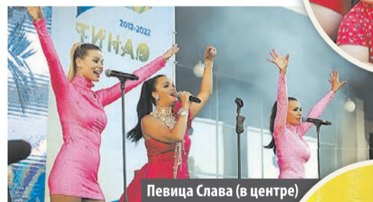
Певица Слава (в центре)