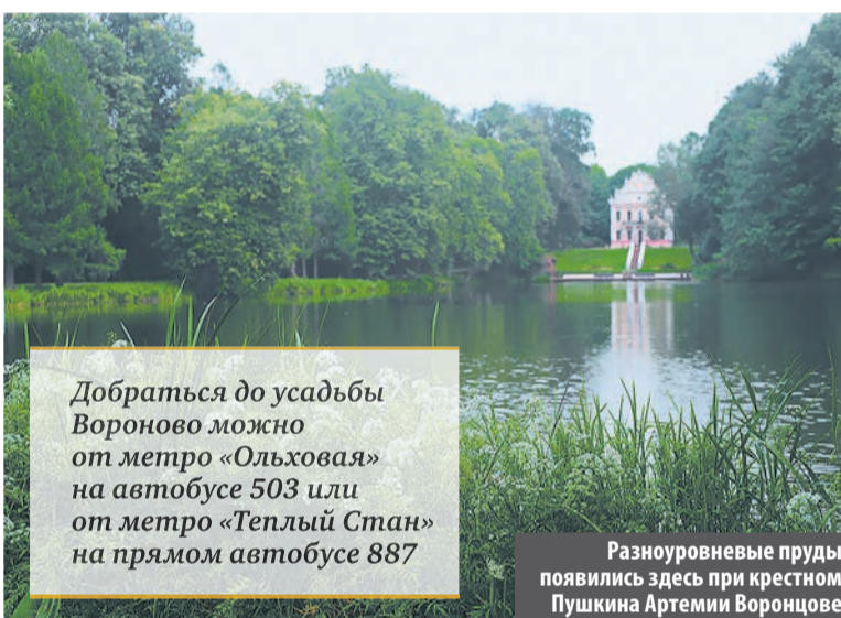
Добраться до усадьбы Вороново можно от метро «Ольховая» на автобусе 503 или от метро «Теплый Стан» на прямом автобусе 887