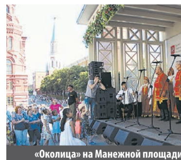
«Околица» на Манежной площади

столько позитивно преподносят музыку, что аж жить хочется! Такой заряд радости получаешь, когда видишь и ощущаешь неравнодушные исполнителя.