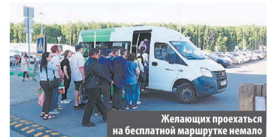
Желающих проехать на бесплатной маршрутке немало

После выезда из города маршрутка едет напрямую до магазина «Леруа Мерлен» без остановок на трассе. Чтобы попасть в Картмазово, нужно выйти на конечной и пройти до ближайшего пешеходного перехода.