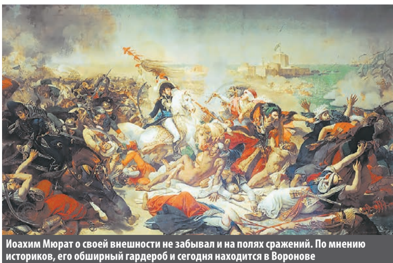
Иоахим Мюрат о своей внешности не забывал и на полях сражений. По мнению историков, его обширный гардероб и сегодня находится в Воронове

рой усадьбой заинтересовались не только историки, но и широкая общественность. По легенде, Ростопчин, занимавший пост гене-