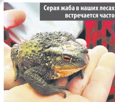
Серая жаба в наших лесах встречается часто