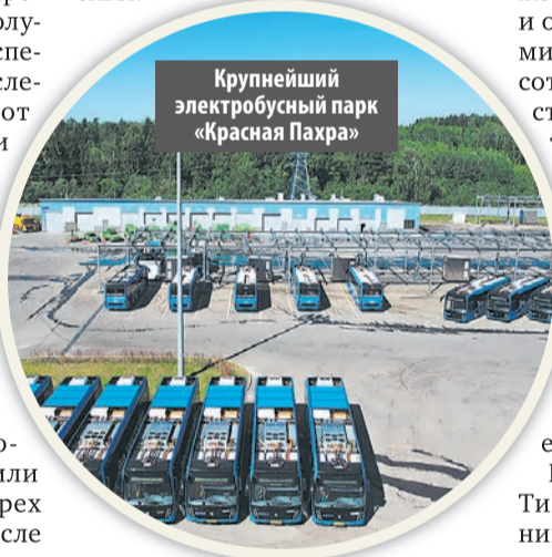
Крупнейший электробусный парк «Красная Пахра»

Кроме того, город продолжает благоустраивать деревни, поселки и садоводческие товарищества, которые стали частью Москвы.